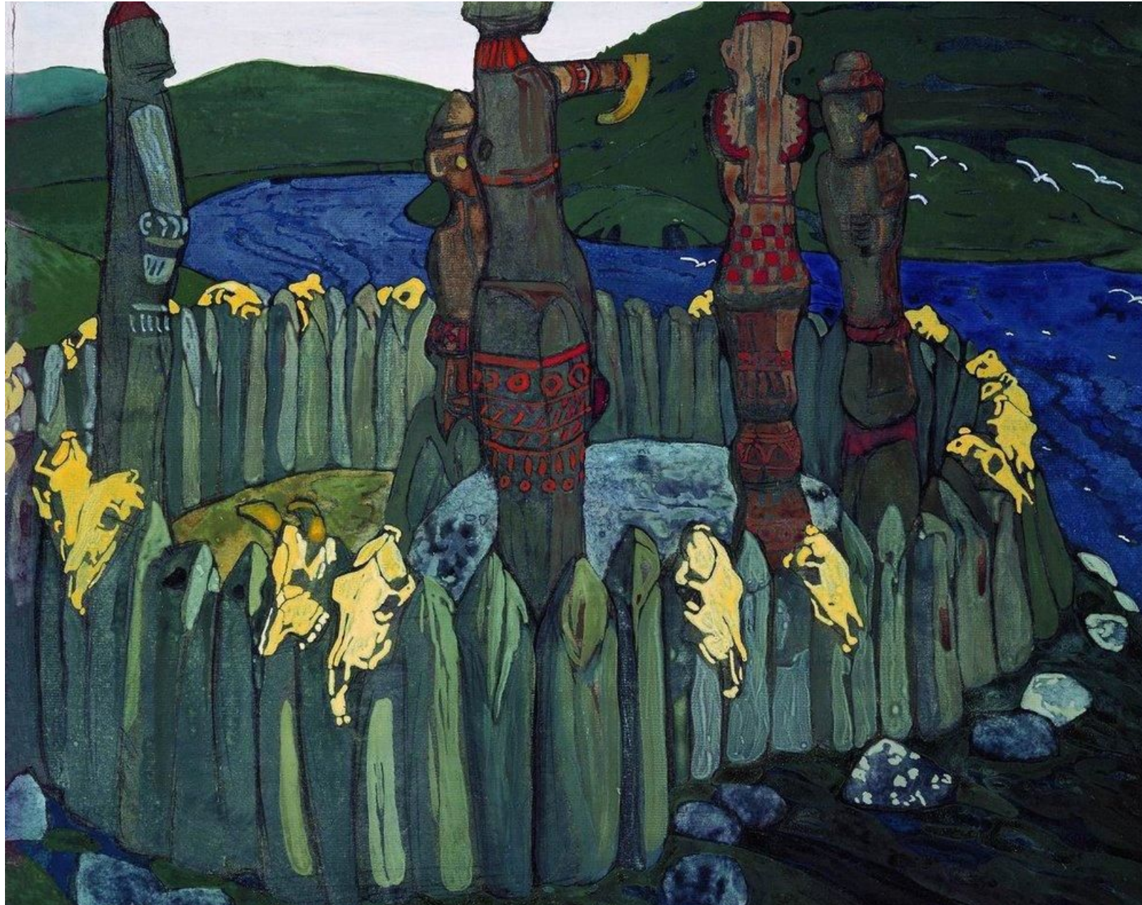
Н.К. Рерих. Идолы