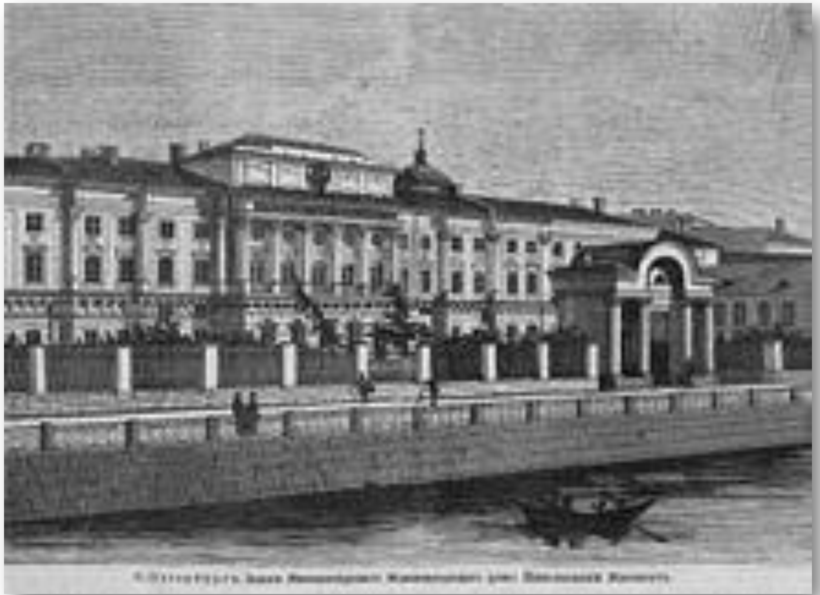
С. ПЕТЕРБУРГ. ДАВА ПЕРВОУЧАЩЕГО УЧИЛИЩНОГО ЗАВЕРШЕНИЯ РАБОТЫ