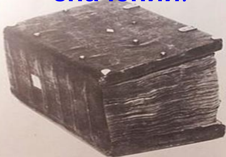
Синодальная Кормчая книга 1282 г.

Словарь – это собрание слов, в алфавитном порядке, с пояснением значений.