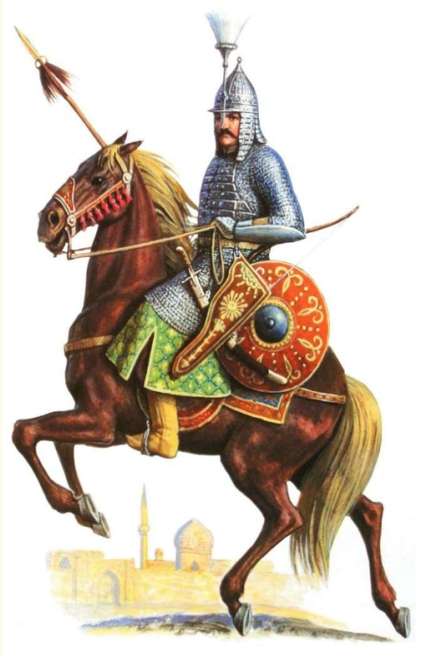
Сипахи (рыцарская конница)