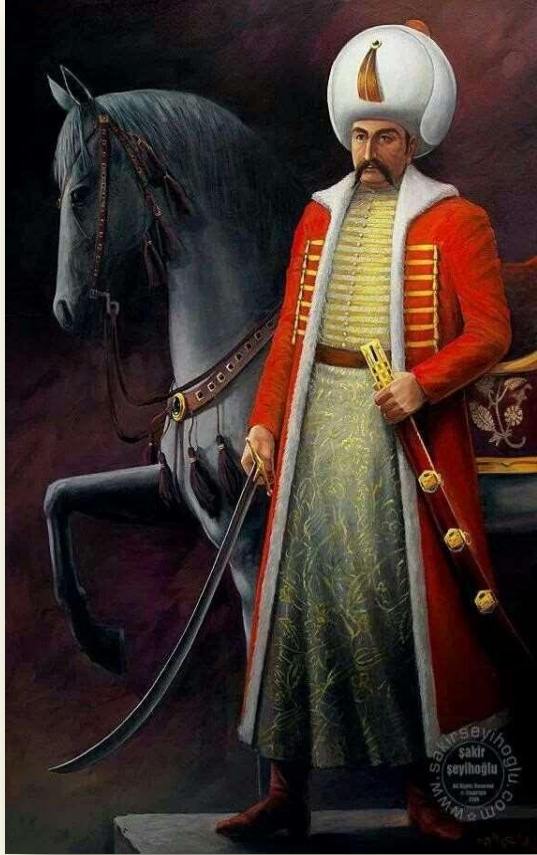
Султан Селим I Грозный (1512 – 1520)