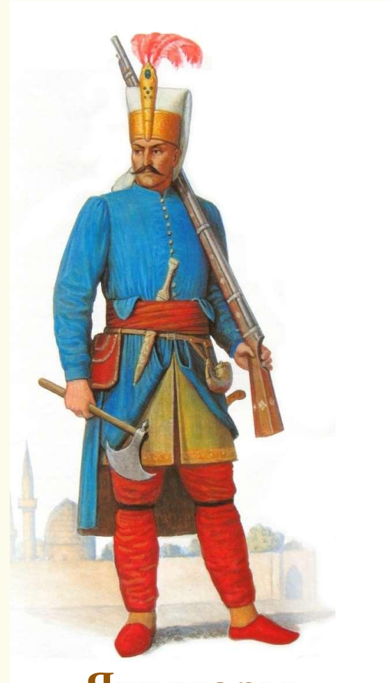
Янычары (пехотные войска)