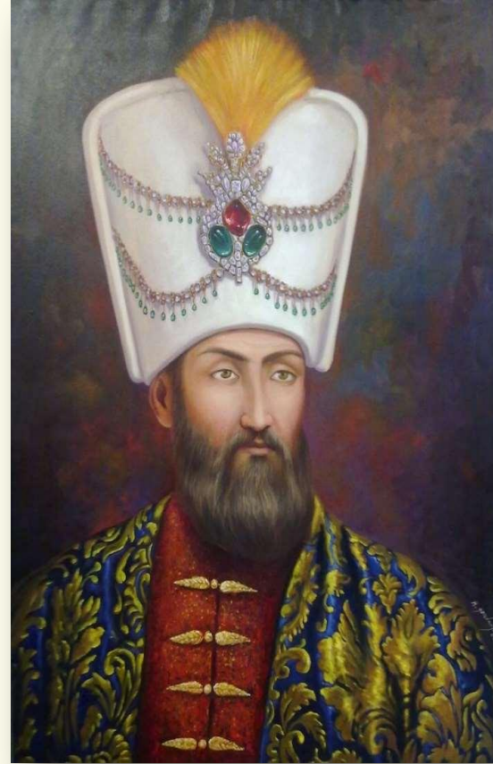
Султан Сулейман I Великолепный (1520 – 1566)