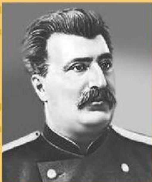
ПРЖЕВАЛЬСКИЙ НИКОЛАЙ МИХАЙЛОВИЧ

- руководитель экспедиции в Уссурийский край (1867-69гг), исследователь Центральной Азии (1870-1885), собрал ценные коллекции диких растений и животных.