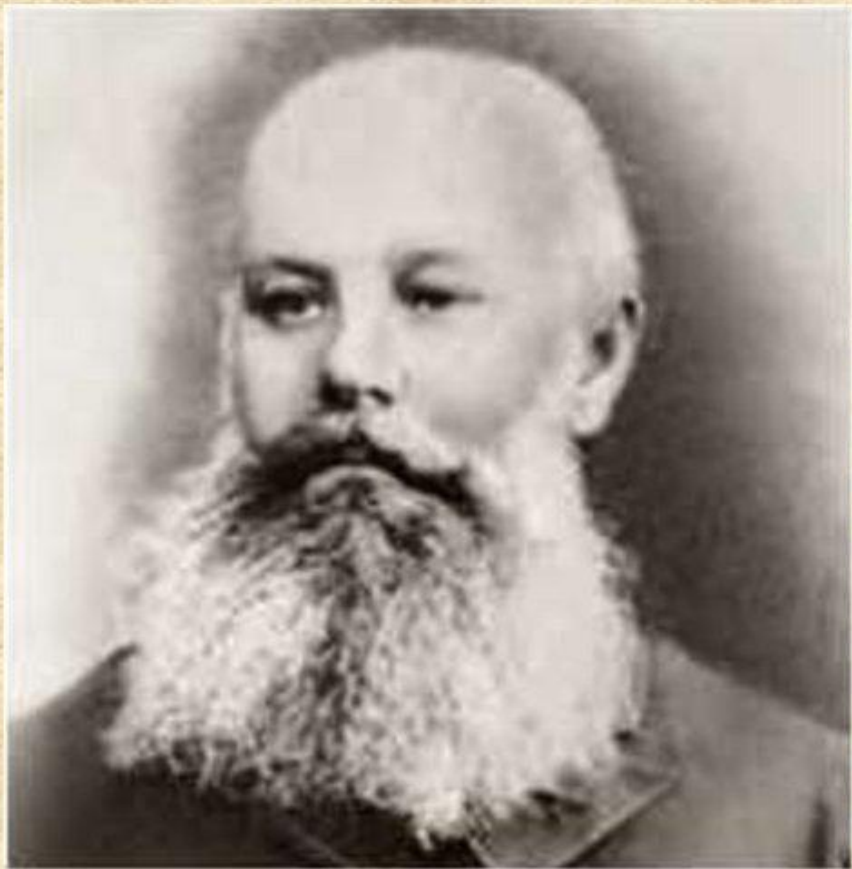
Василий Васильевич Докучаев (1.03.1846 - 8.11.1903 гг.)