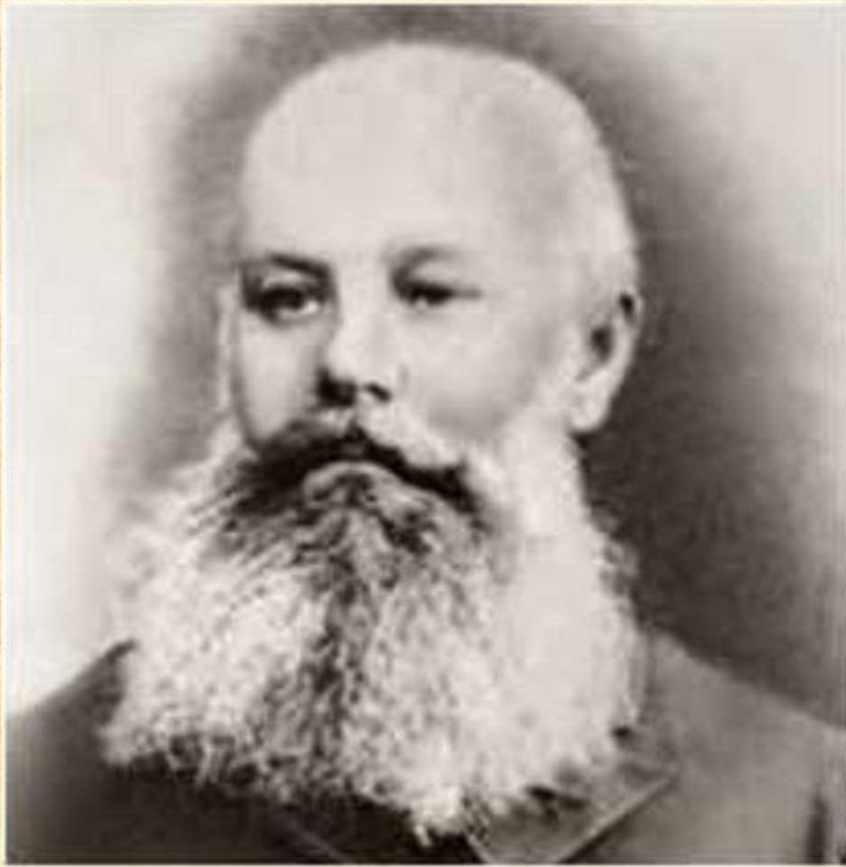
Василий Васильевич Докучаев (1.03.1846 - 8.11.1903 гг.)