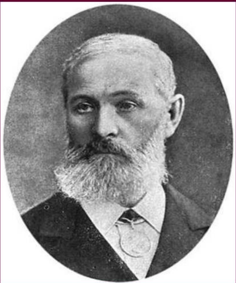
Павел Егорович Чехов, отец писателя