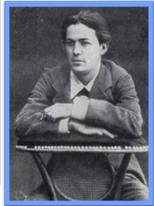
Чехов – студент университета