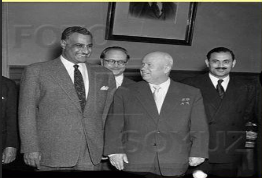
Гамаль Абдель Насер и Н.С. Хрущев в Москве 1958.

В поисках противовеса британскому влиянию на Ближнем Востоке Насер начал сближение с СССР.