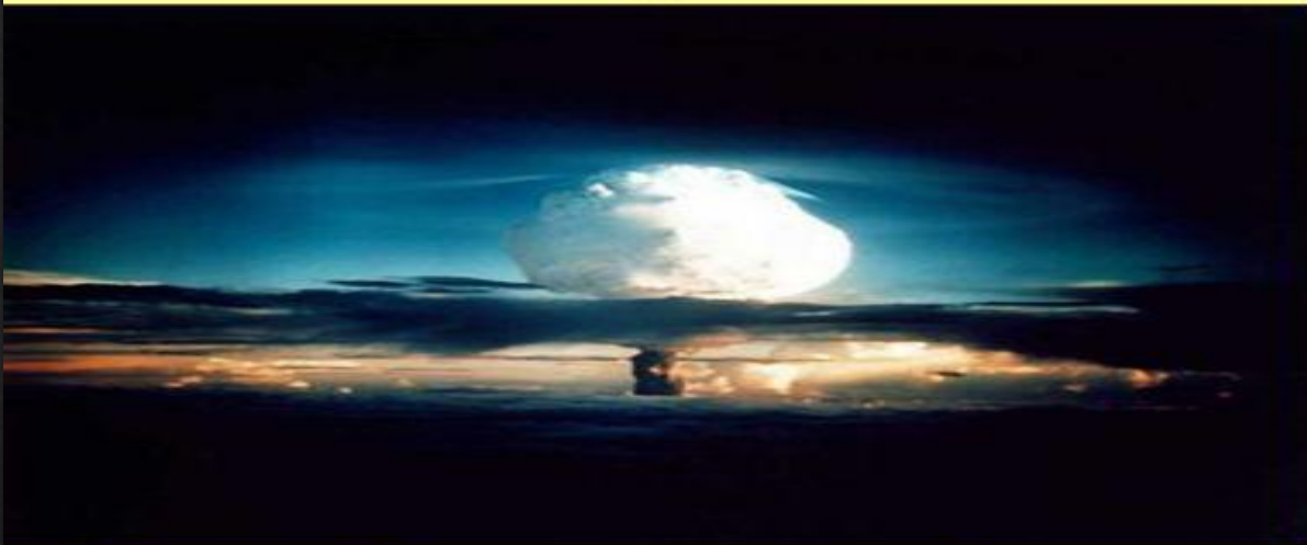
Ядерный взрыв на Новой земле. 1958 г.

Во второй половине 50-х гг. резко усилилась гонка вооружений между СССР и США. Осенью 1957 г. Москва предложила ввести мораторий на испытания ядерного оружия. В 1958 г. СССР в одностороннем порядке прекратил испытания.