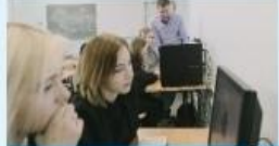
Современные компьютерные классы