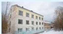
2 корпус: Архангельск, ул. Сидикатчиков, 10