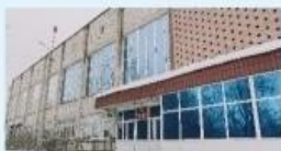
1 корпус: Архангельск, пр. Обводный, д.2