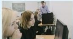
Современные компьютерные классы