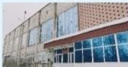
1 корпус: Архангельск, пр. Обводный, д.2