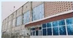
1 корпус: Архангельск, пр. Обводный, д.2