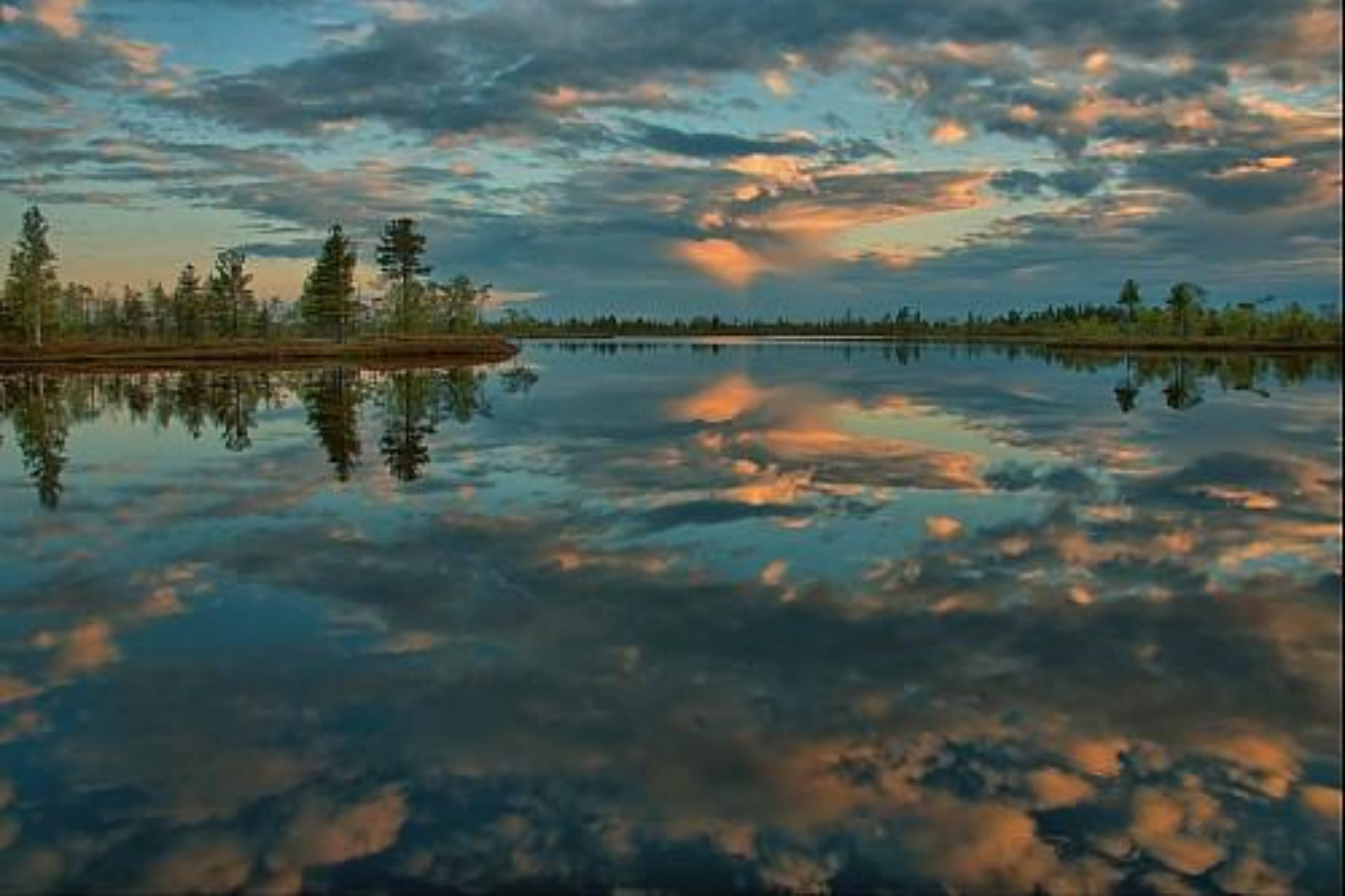
исток Большого Югана (Большое Васюганское болото)