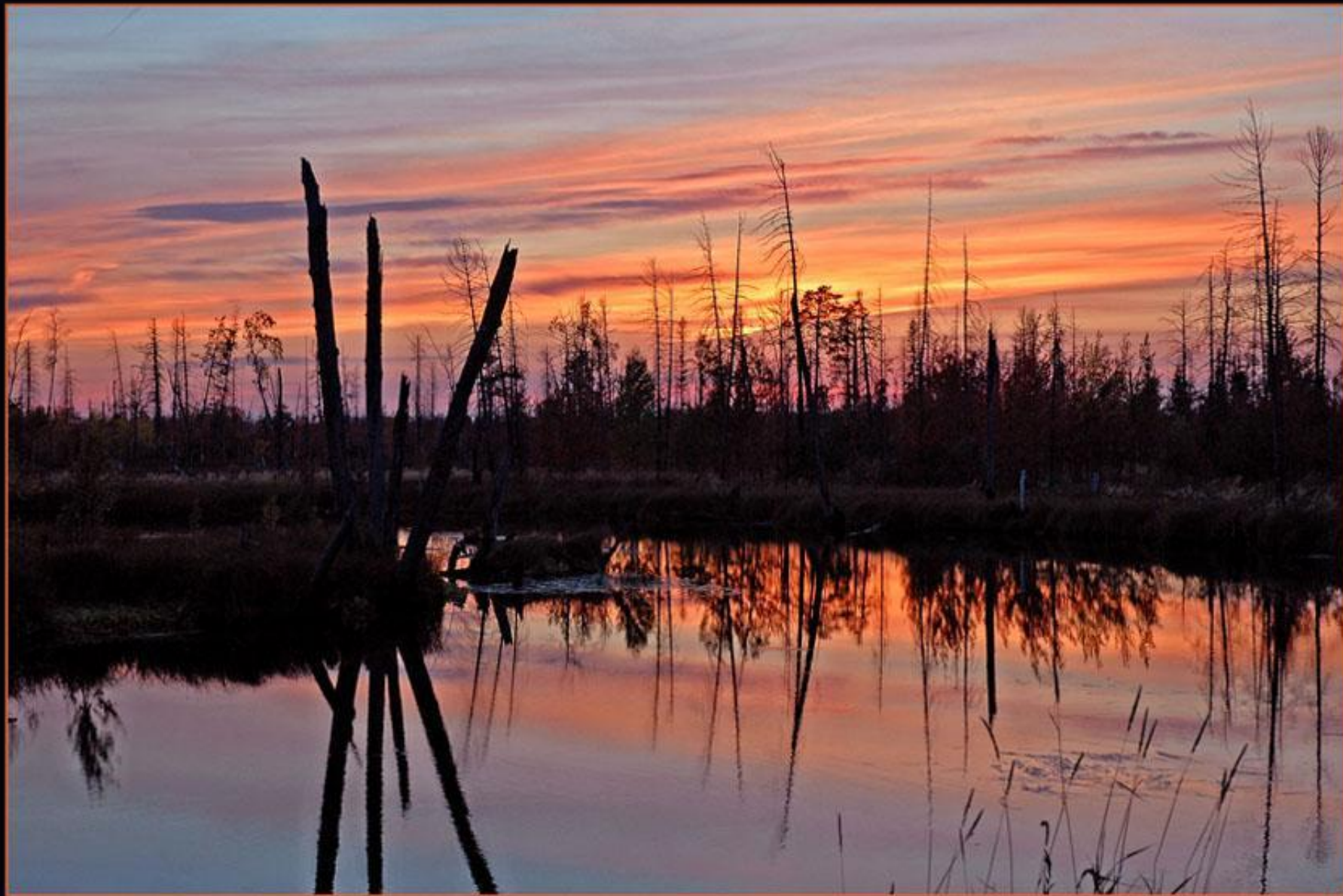
Западная Сибирь ХМАО Югра Сургут Аган таёжная река болота закат...