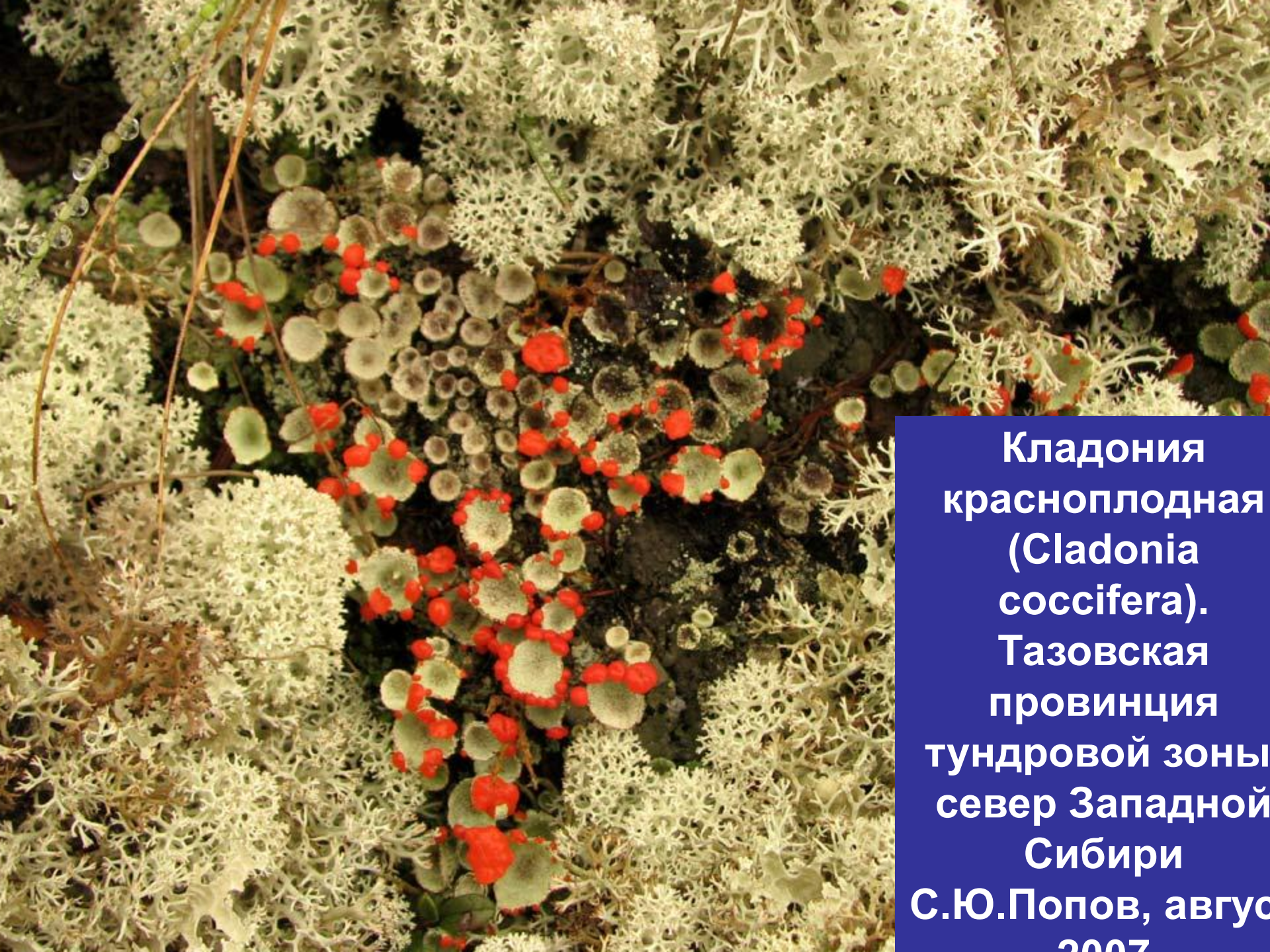
Кладония красноплодная ( Cladonia coccifera ). Тазовская провинция тундровой зоны север Западной Сибири С.Ю.Попов, август 2007