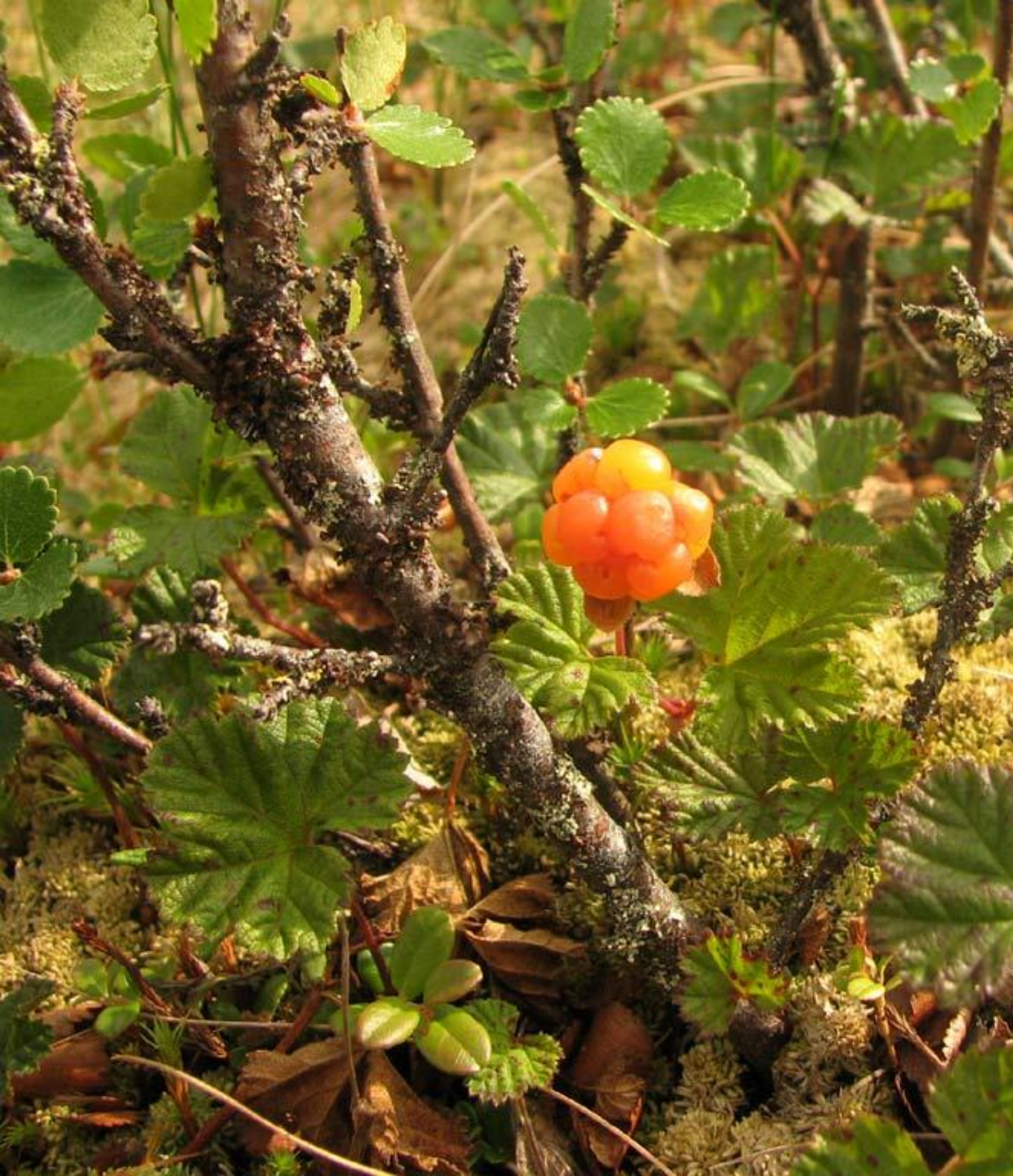
Морошка ( Rubus chamaemorus ) на пухляково- сфагновом болоте. Тазовская провинция тундровой зоны, север Западной Сибири С.Ю.Попов, август 2007