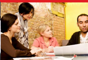
Безопасность и контроль