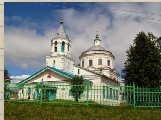
Свято-Вознесенский храм из этого села