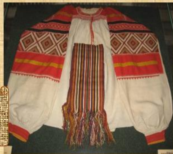
Рубашка женская «Станушка».

Одним из значимых декоративных элементов народного костюма разных центров рязанского региона была вышивка. В ее колорите ярко проявляется типичная для рязанского прикладного искусства декоративность, основанная, как правило, на сочетании красного и белого. Важную роль играло и богатство фактур, создаваемое контрастом зрешенной основы и плотной перевити или строчки.