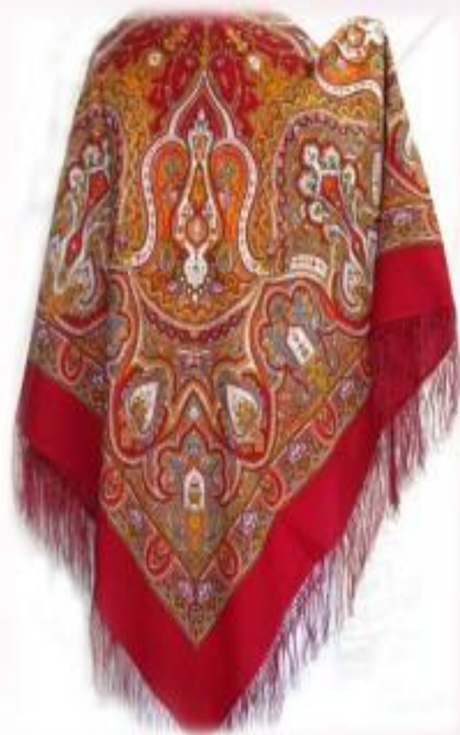
Павловские платки и шали