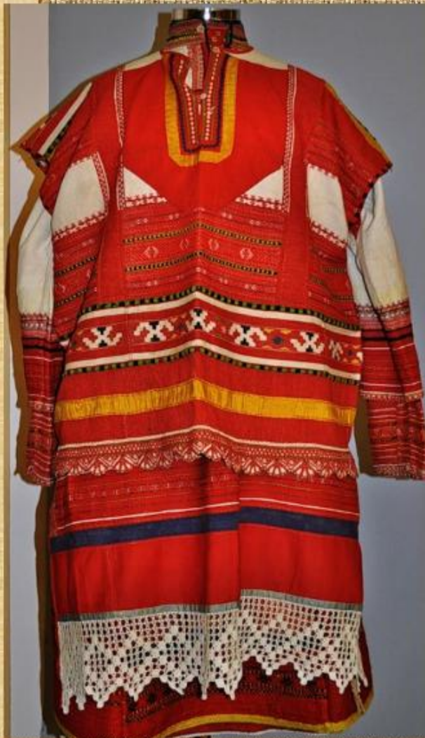
Костюм Рязанской губернии

Одним из значимых декоративных элементов народного костюма разных центров рязанского региона была вышивка. В ее колорите ярко проявляется типичная для рязанского прикладного искусства декоративность, основанная, как правило, на сочетании красного и белого. Важную роль играло и богатство фактур, создаваемое контрастом зрешенной основы и плотной перевити или строчки.