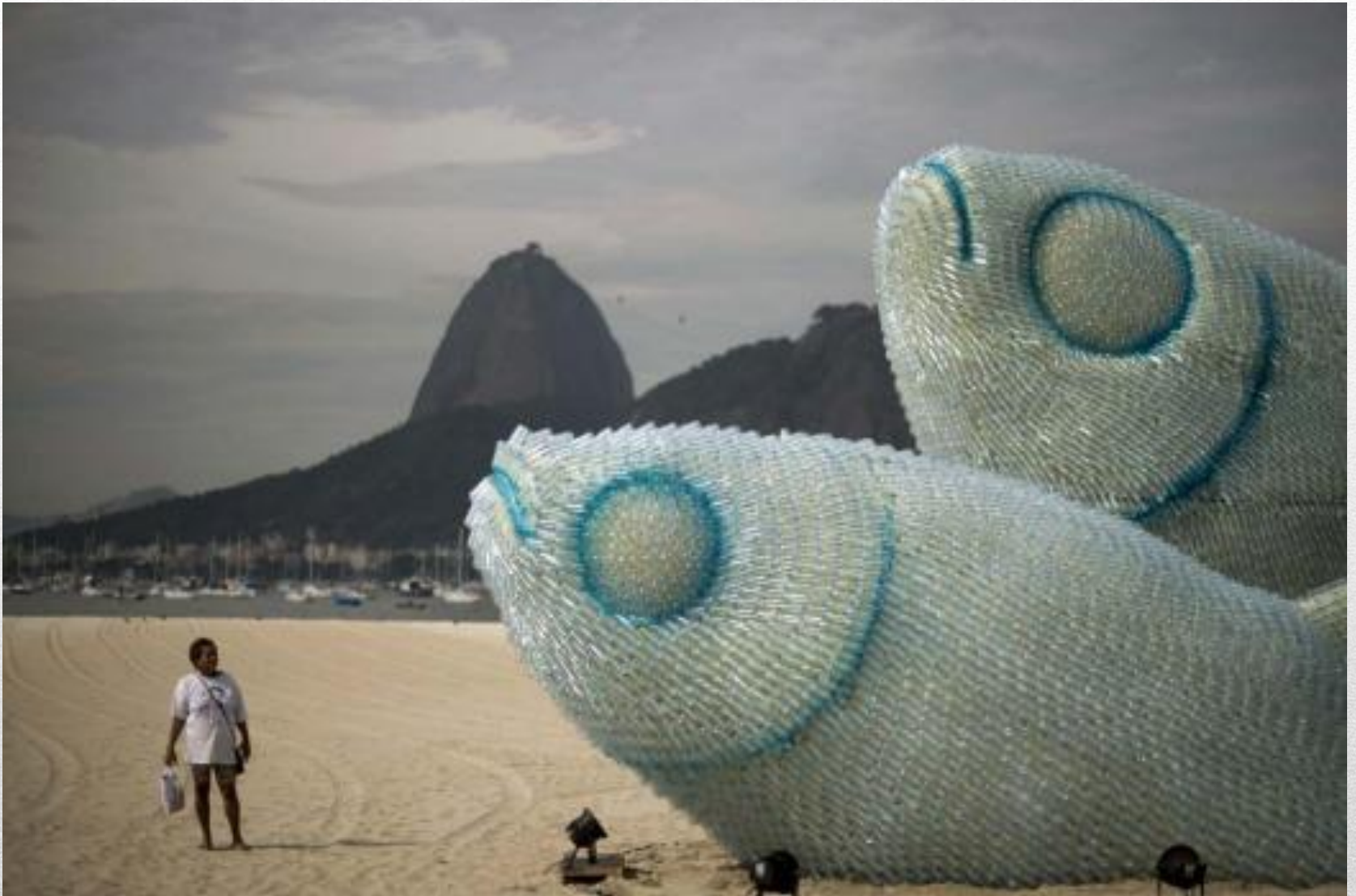
На пляже Ботафого в Рио-де-Жанейро