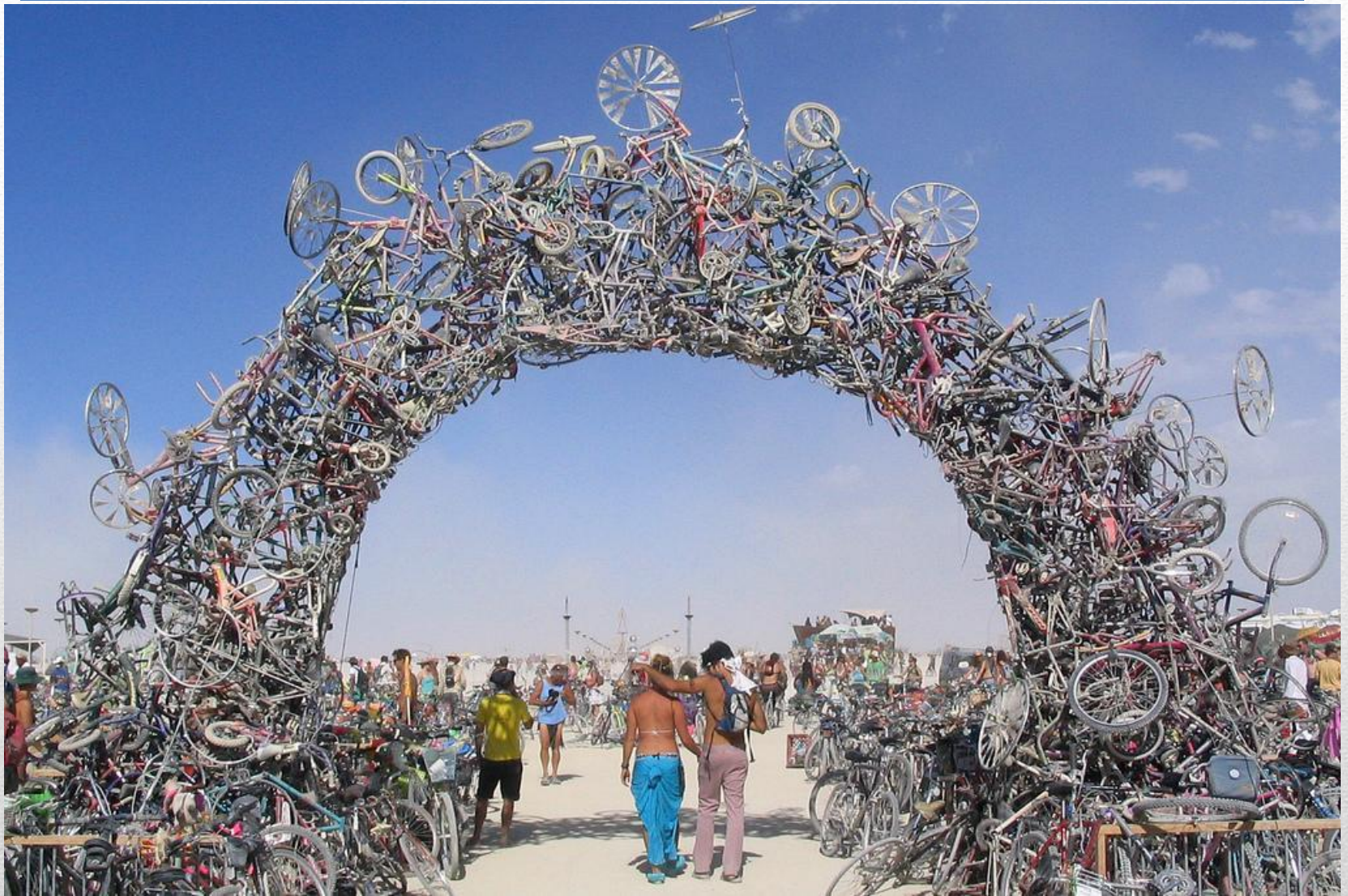
Арт- объект находится в пустыне Блэк-Рок, штат Невада