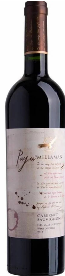
Paya de Millaman DO