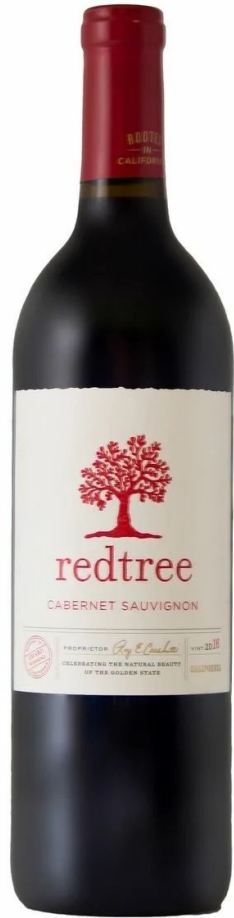
Red Tree CABERNET SAUVIGNON