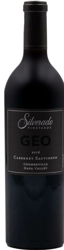
Silverado Cabernet Sauvignon Geo AVA