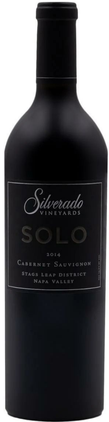
Silverado Cabernet Sauvignon Solo AVA