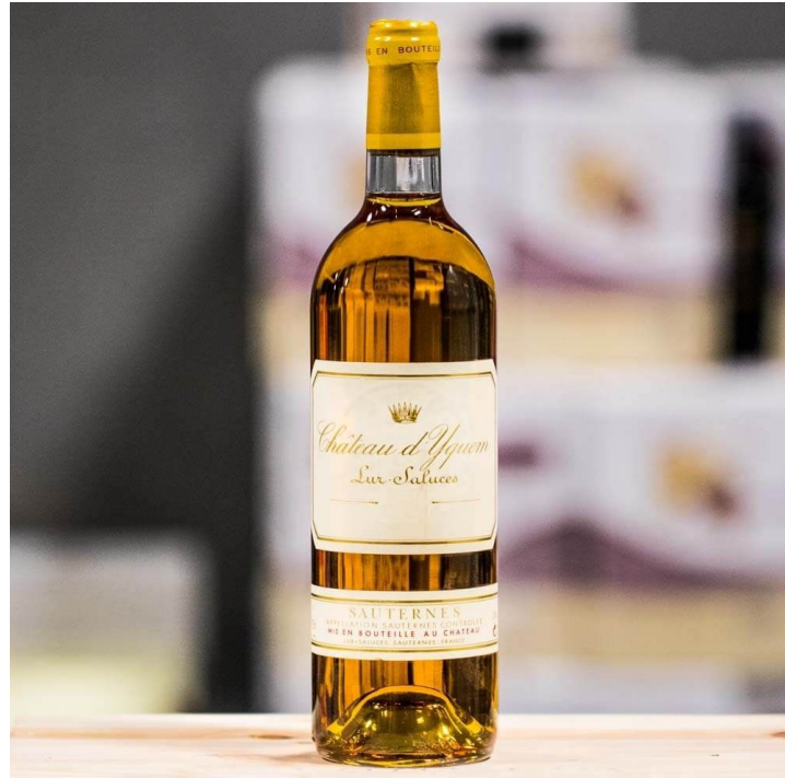
Yquem или Pier Castel