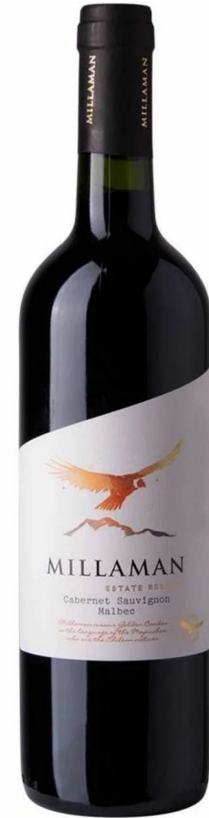
Millaman Estate Reserve DO