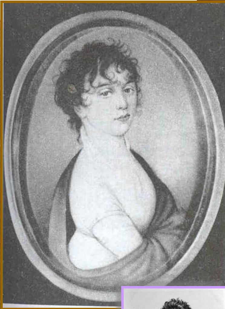
Джюльетта Гвиччарди С портрета неизвестного художника