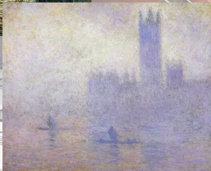
К.Моне «Здание парламента в Лондоне»