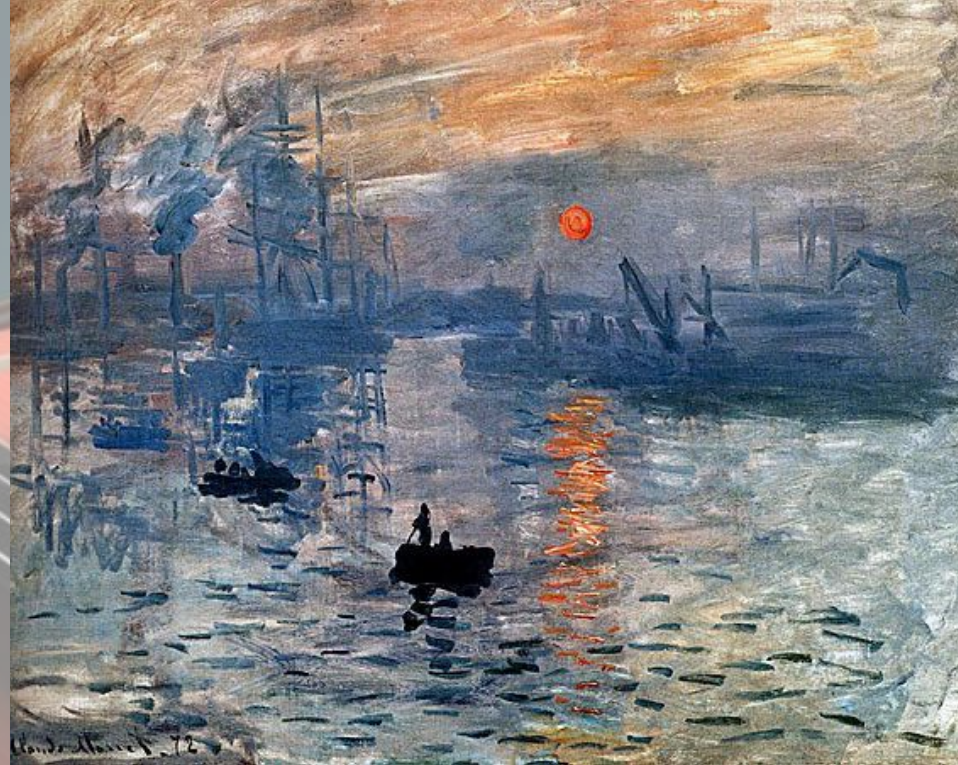
«Впечатление. Заход солнца»

Импрессионизм (от impression — впечатление) — направление в искусстве, в котором авторы стремились передать жизнь в непосредственной форме, как отражение своих впечатлений.