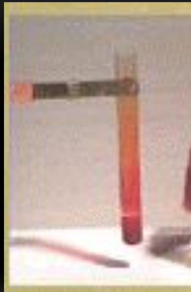
Держатель для пробирок