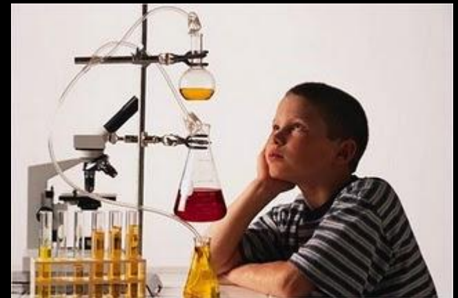
штатив для пробирок