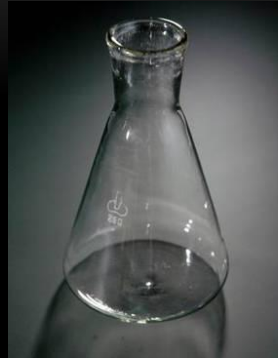
Колба Кьёльдаля коническая