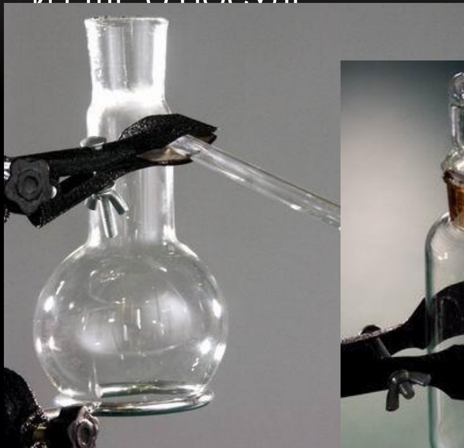
колба Вюрца перегонная