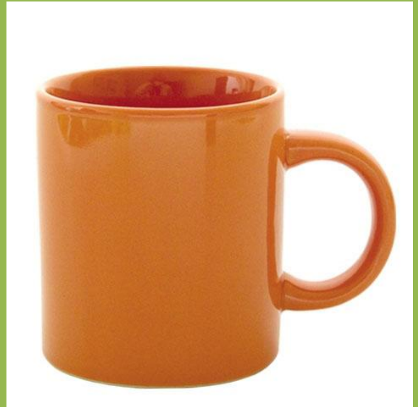
очень большая кружка