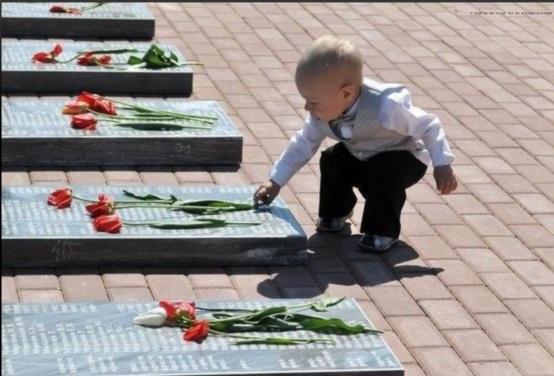
Вспомните героев Великой Отечественной войны. Всех павших на войне с фашистами.