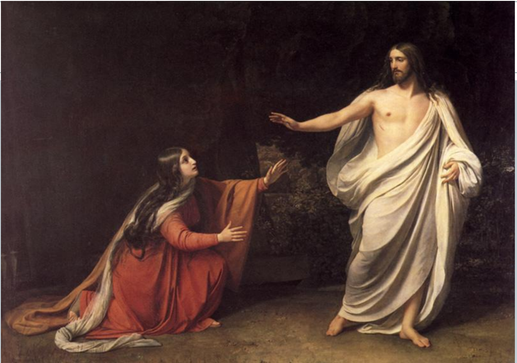
Иванов А.А. «Явление Христа Марии Магдалине после воскресения»