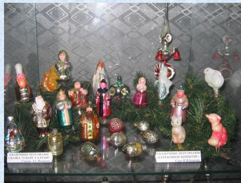
Склянные персонажи. СКАЗКА "УШАК С БУДАН" Создан А.С. Пономарев