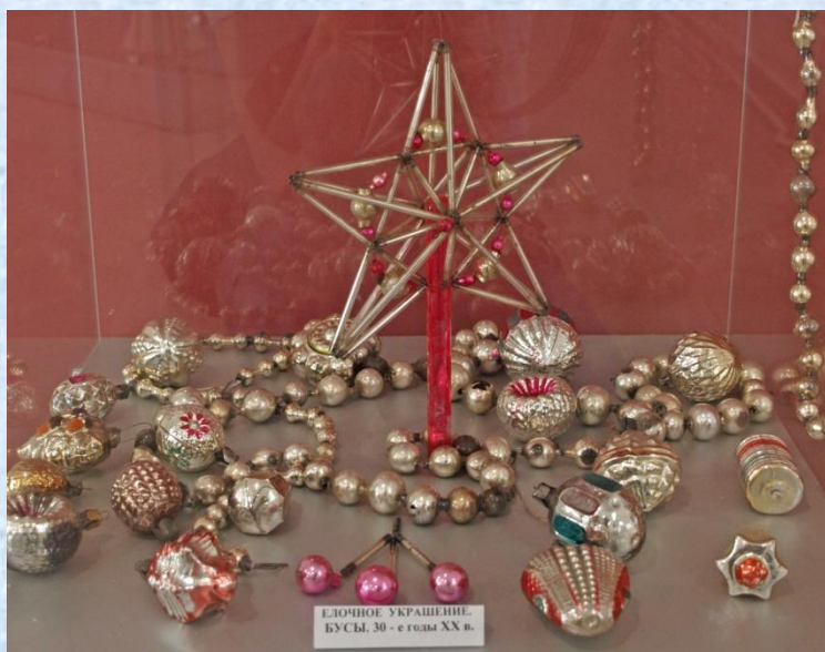
Елочное украшение. БУСЫ. 30 - е годы XX в.

Фабричное производство елочных игрушек было впервые налажено в России в годы Первой мировой войны. В то время в городе Клин существовал стекольный завод, принадлежавший с 1848 года князьям Меншиковым. На этом заводе из цветного стекла изготавливались лампы, бутылки и пузырьки для аптек. В войну в Клин попали пленные немецкие солдаты. Они-то научили русских мастеров выдувать из стекла елочные шарики и бусы.