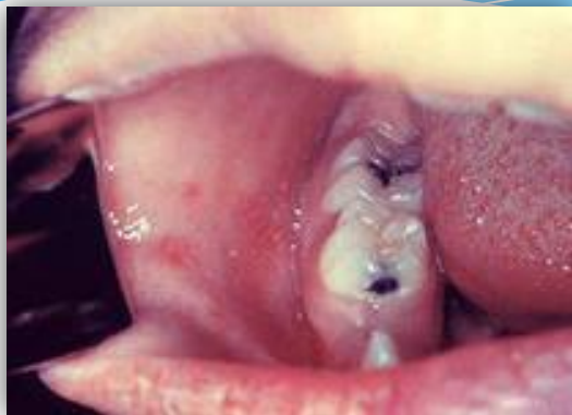
Пятна Филатова- Коплика