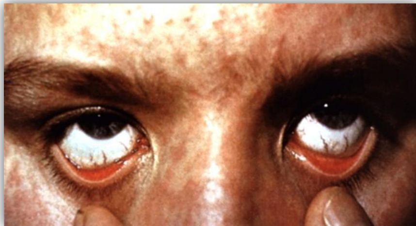
Конъюнктивит при кори