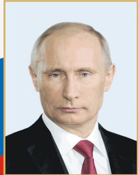
ПУТИН ВЛАДИМИР ВЛАДИМИРОВИЧ Президент Российской Федерации