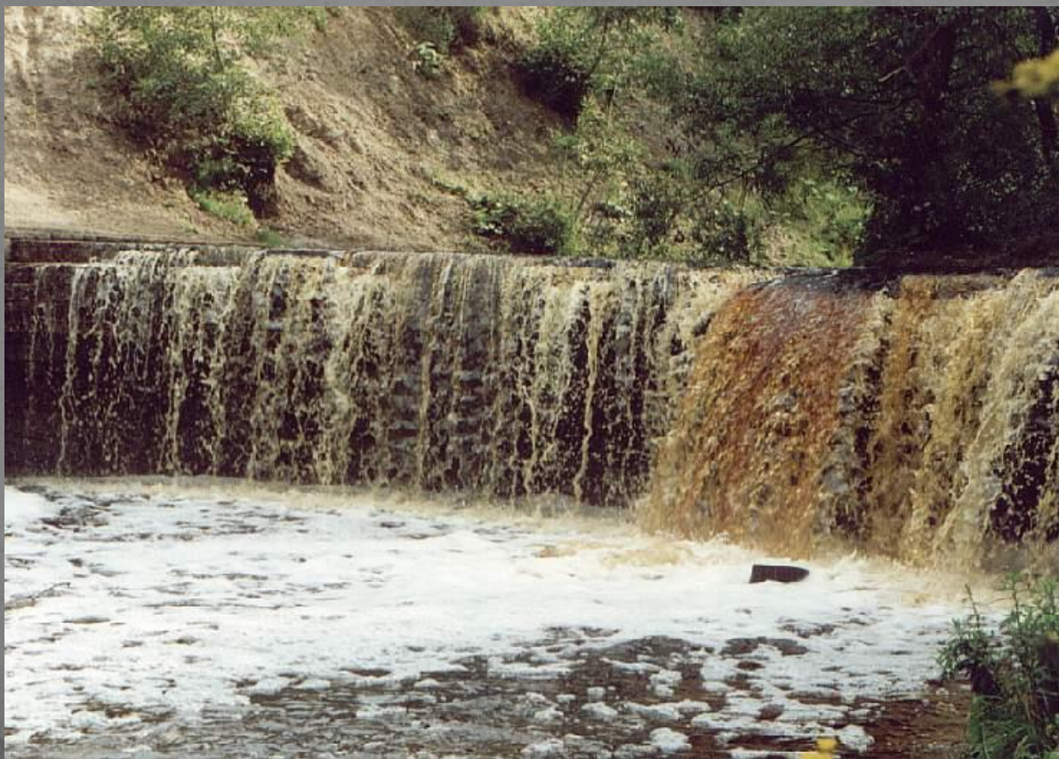
Водопад на реке Саблинка