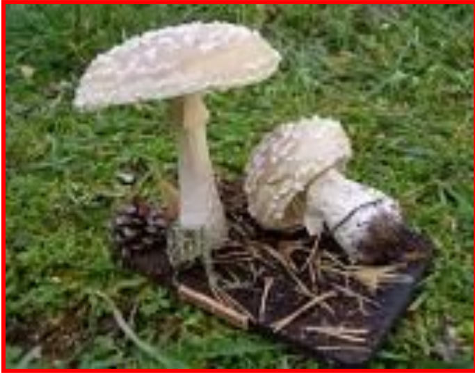
Мухомор шероховатый. Встречается редко, несъедобен.