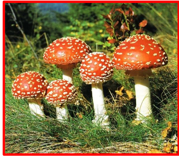
Мухомор красный. Встречается очень часто, ядовитый гриб.