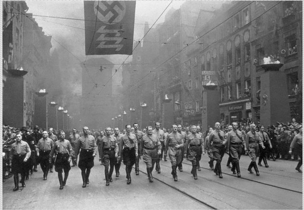
Баварскі путч («Піўны путч»)

Пасля арганізацыі ў 1923 году Баварскага путчу («Піўны путч») Гітлер быў арыштаваны і асуджаны на 5 гадоў.