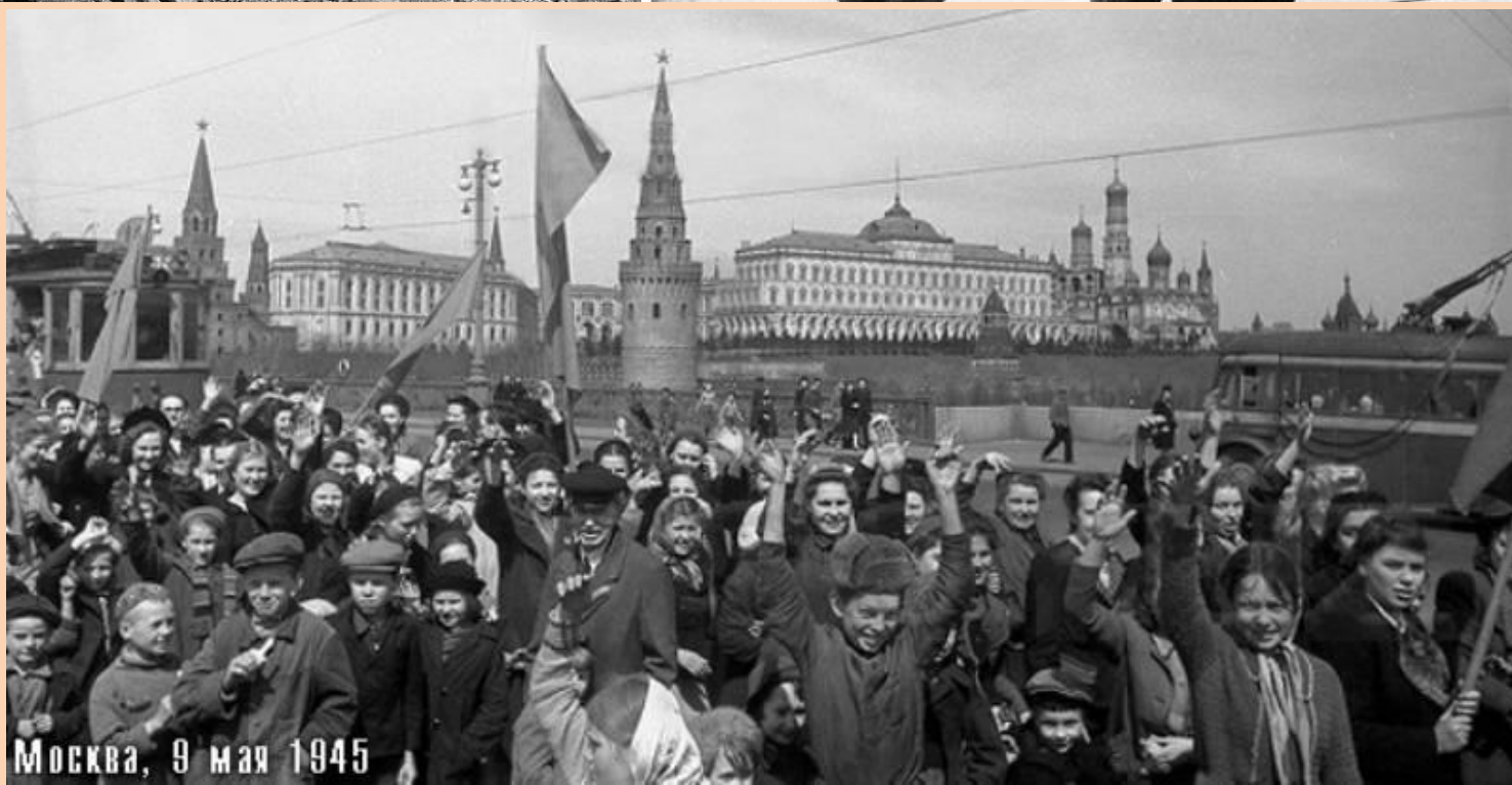
Москва, 9 мая 1945