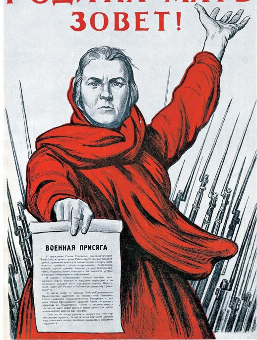
Плакат «Родина-мать зовёт!» Художник И.М. Тоидзе. 1941 г.