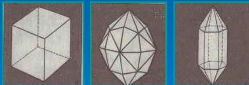
Кристаллы каменной соли, кварца, арагонита