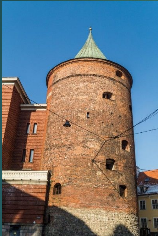
Пороховая (Песочная) башня, свидетель осады 1621 г