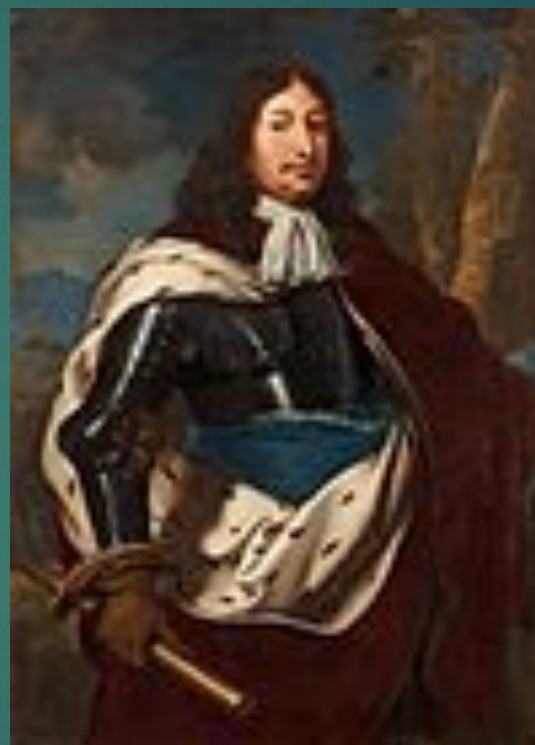
Карл X Густав