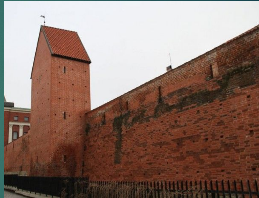
Восстановленная стена рижской крепости с башней Рамера