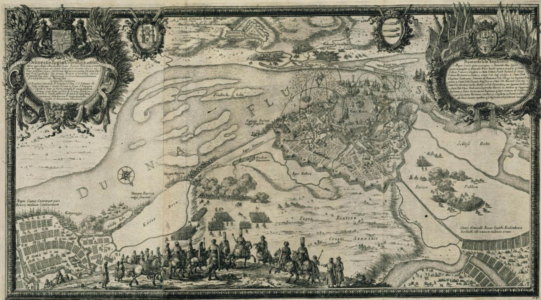
Осада Риги в 1656 году. Гравюра XVII века