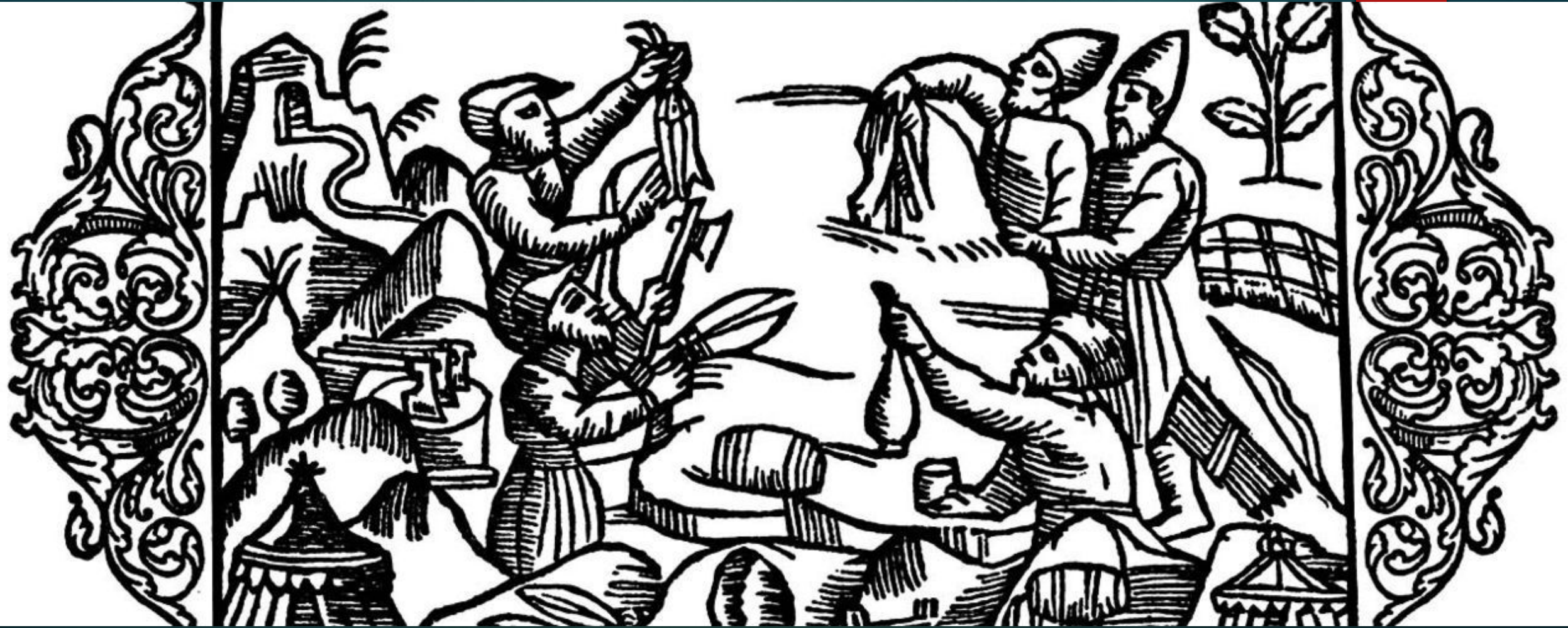
Обмен между скандинавами и русскими. Гравюра 1555 года.