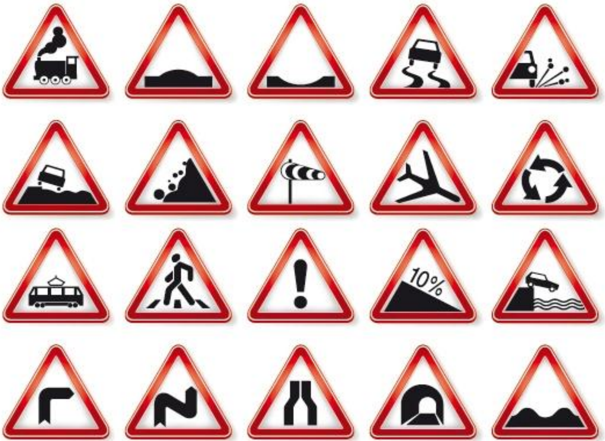
ПРЕДУПРЕЖДАЮЩИЕ ДОРОЖНЫЕ ЗНАКИ.