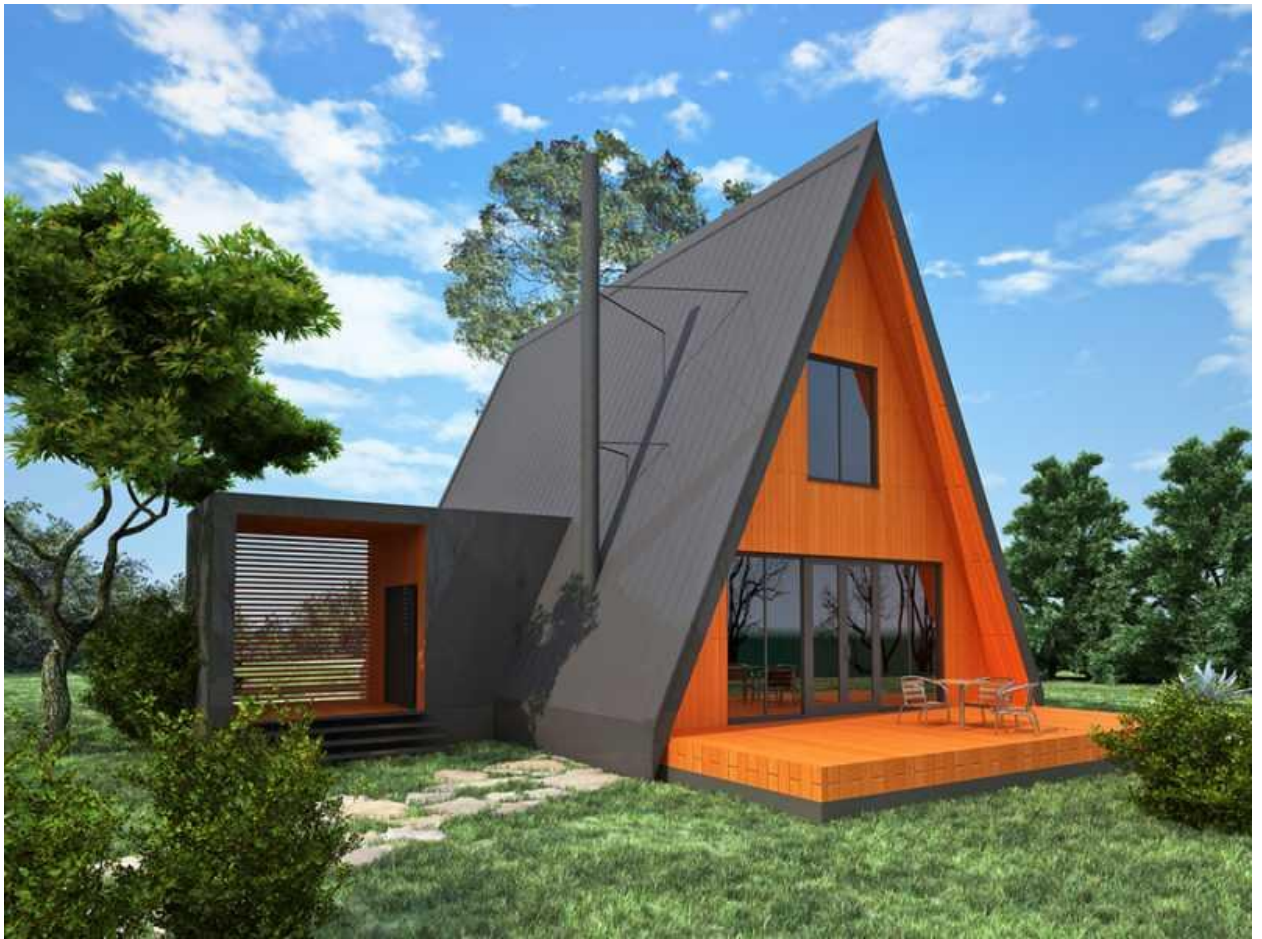
Дом под треугольной крышей