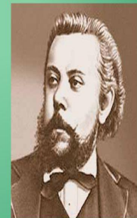
Портрет работы Репина Музыка

ПОСЛУШАЙ: https://go.mail.ru/search_video?fm=1&q=мусоргский%20богатырские%20ворота%20слушают&frm=ws_p&d=4755481617555033471&s=youtube&sig=7d336e6d97