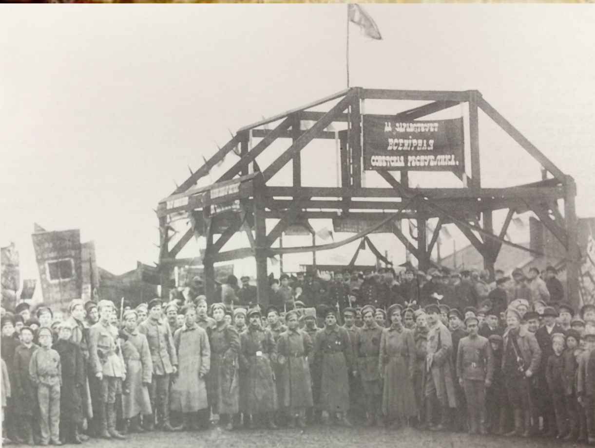
У трибуны на Привокзальной площади

Первыми о победе Октябрьской революции узнали рузаевские телеграфисты и железнодорожники, принявшие по телеграфу декреты II съезда Советов. В честь этого события 26 октября 1917 года на крышах вокзала и других зданий станции Рузаевка были вывешены красные знамена. На вокзальной площади и в депо проходили митинги рабочих.