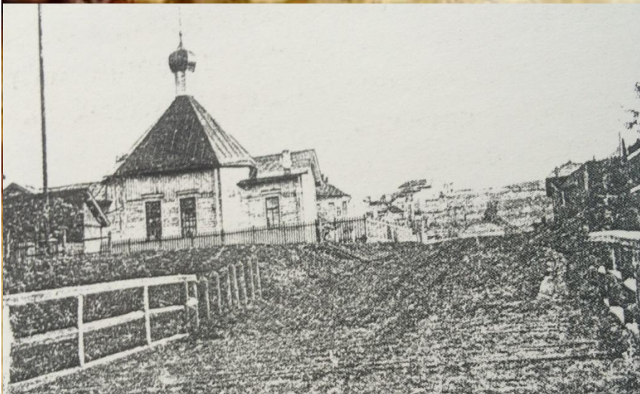
Рузаевка старая. 1917 год.