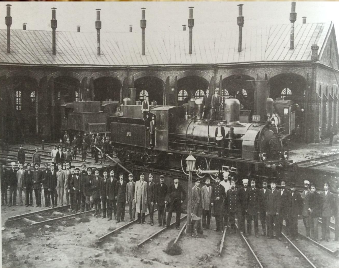
Работники депо станции Рузаевка

В конце апреля- начале мая 1917 года в Рузаевке состоялось совещание железнодорожной комиссии. Совещание приняло решение о создании в Рузаевке Совета рабочих, крестьянских и солдатских депутатов.