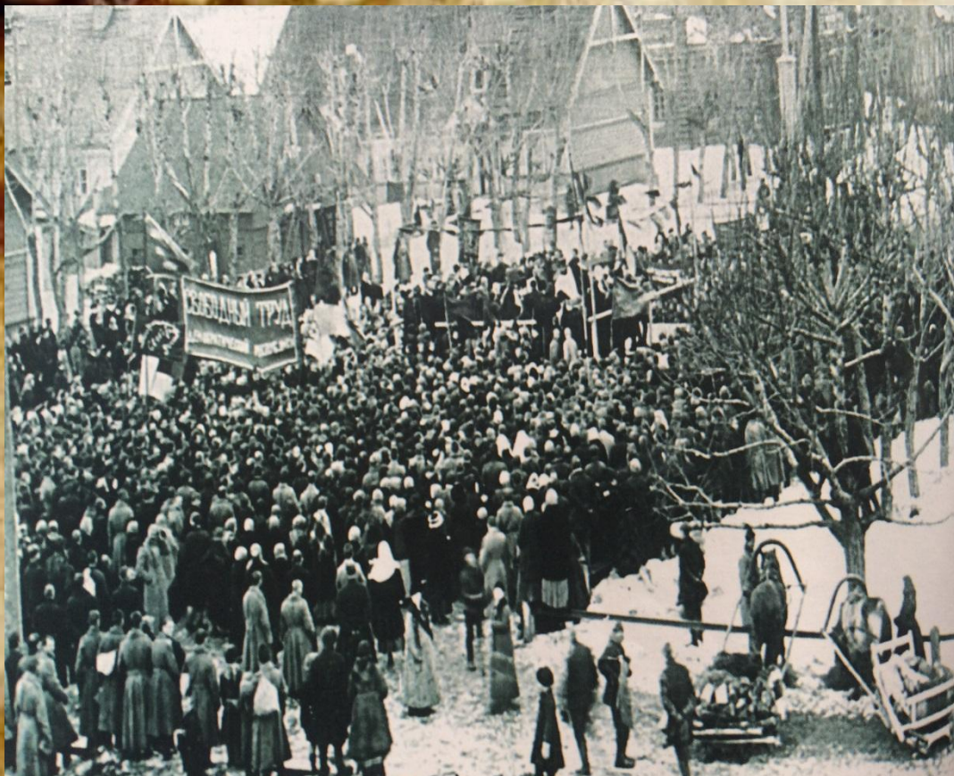
Демонстрация на Привокзальной площади ст. Рузаевка. Февраль 1917 года