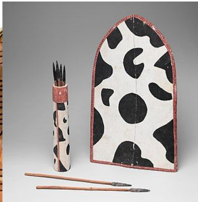
Щит и копья