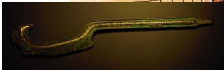
Хопеш (похож на боевой топор и меч)