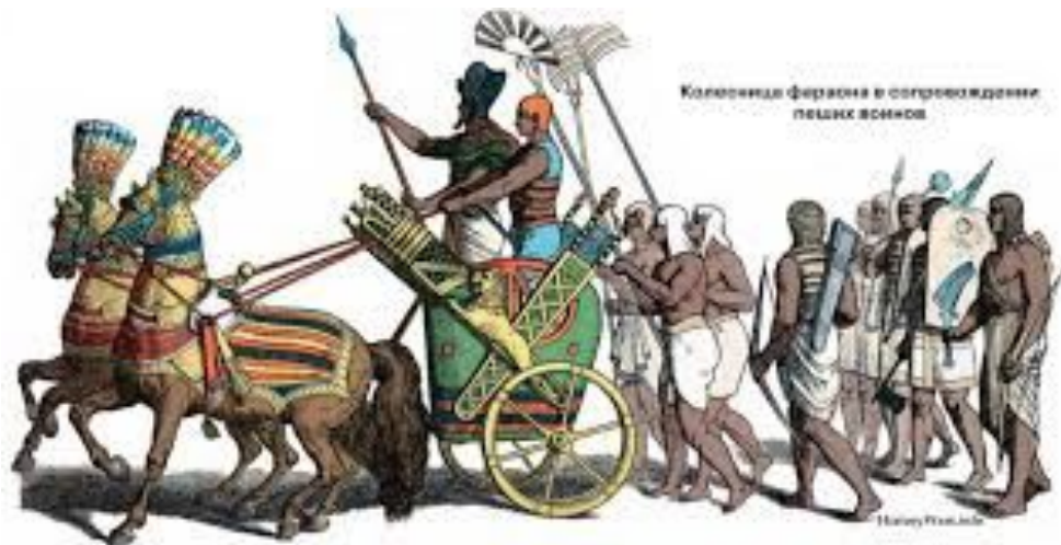
Колесница фараона в сопровождении пеших воинов