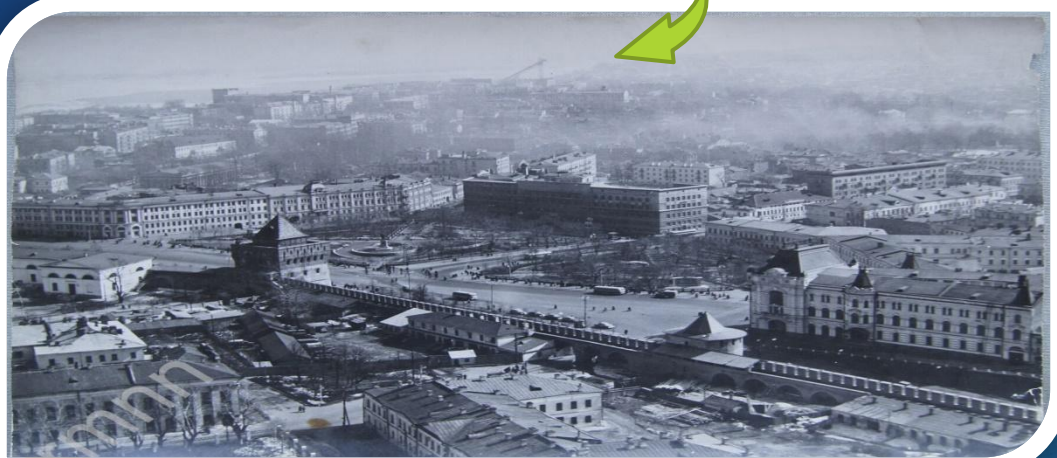
Кремль, 50-60-е годы