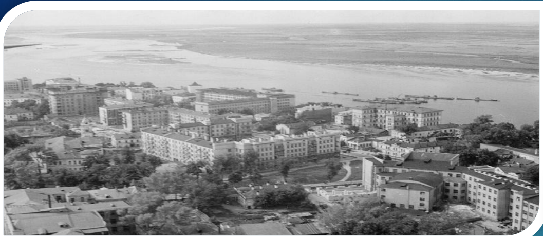
Фото города в 50-60-е годы