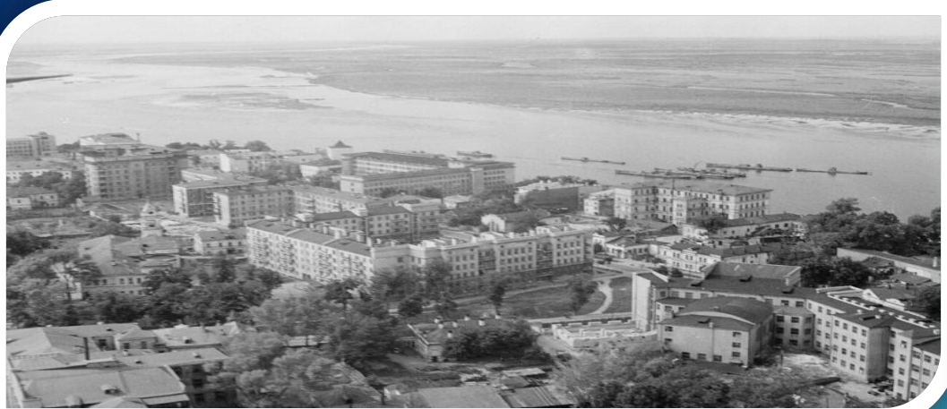
Фото города в 50-60-е годы