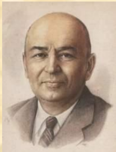
В. Я. ШЕБАЛИН

ОСНОВНОЕ СОДЕРЖАНИЕ — ЛИРИКА, ПЕРЕДАЧА ЧУВСТВ И НАСТРОЕНИЙ, ПЕЙЗАЖНЫЕ ЗАРИСОВКИ.