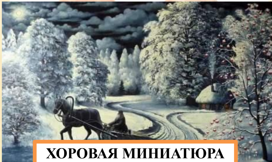
ХОРОВАЯ МИНИАТЮРА «ЗИМНЯЯ ДОРОГА»