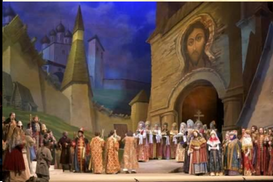
Н.А. РИМСКИЙ-КОРСАКОВ. ХОР ИЗ ОПЕРЫ «ПСКОВЕТЯНКА»