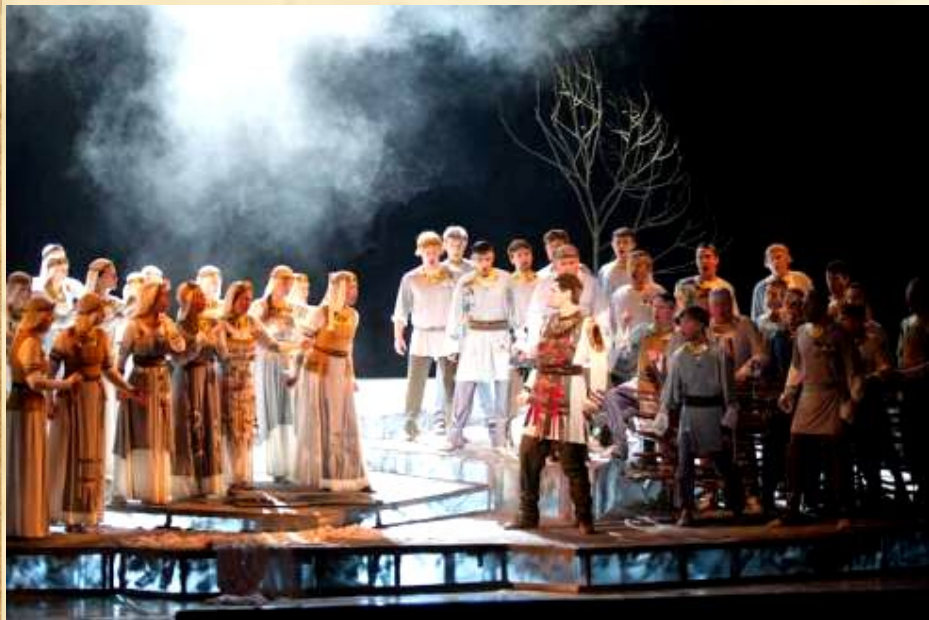
Н.А. РИМСКИЙ-КОРСАКОВ. ЗАКЛЮЧИТЕЛЬНЫЙ ХОР ИЗ ОПЕРЫ «СНЕГУРОЧКА»