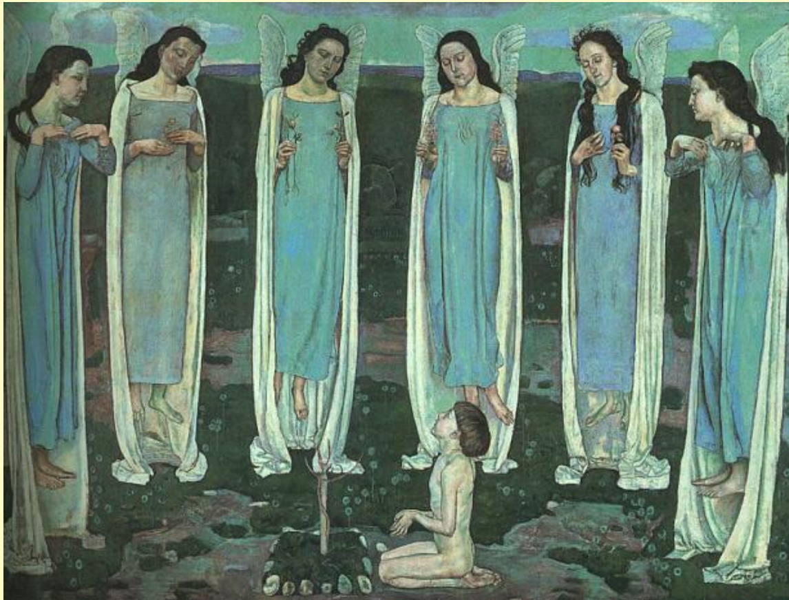
Избранный 1893-94 г.г.