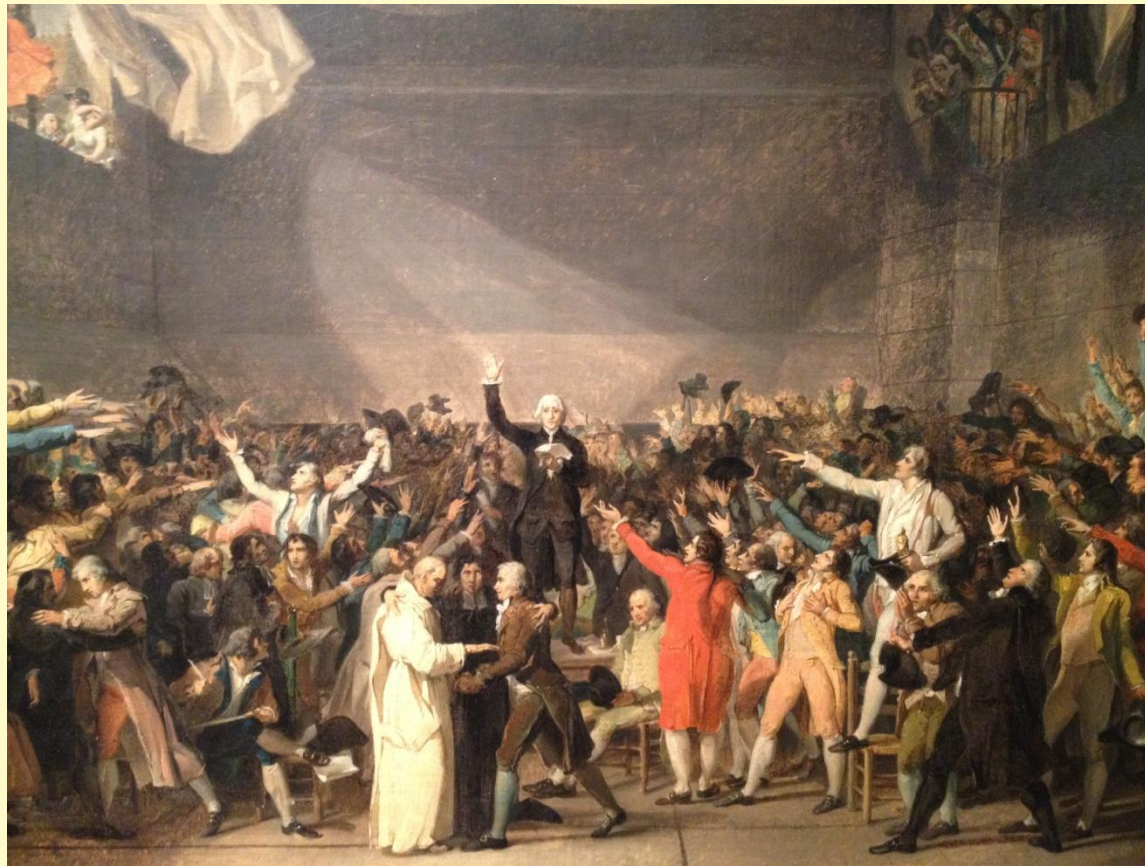
Жак Луи Давид «Клятва в Зале для игры в мяч».