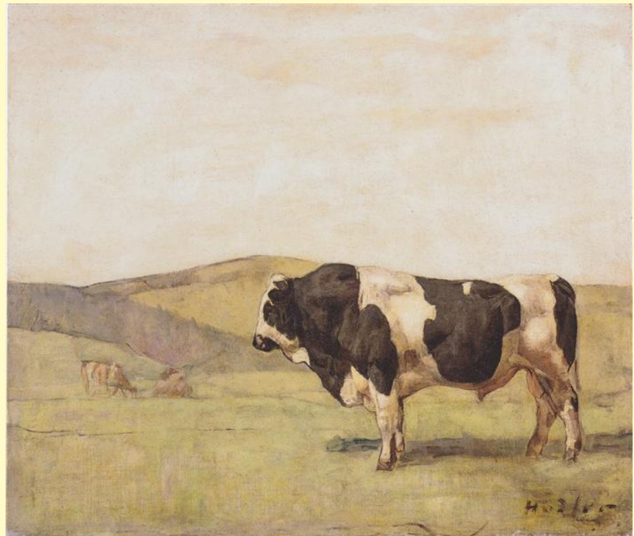
Бык. 1978 г.