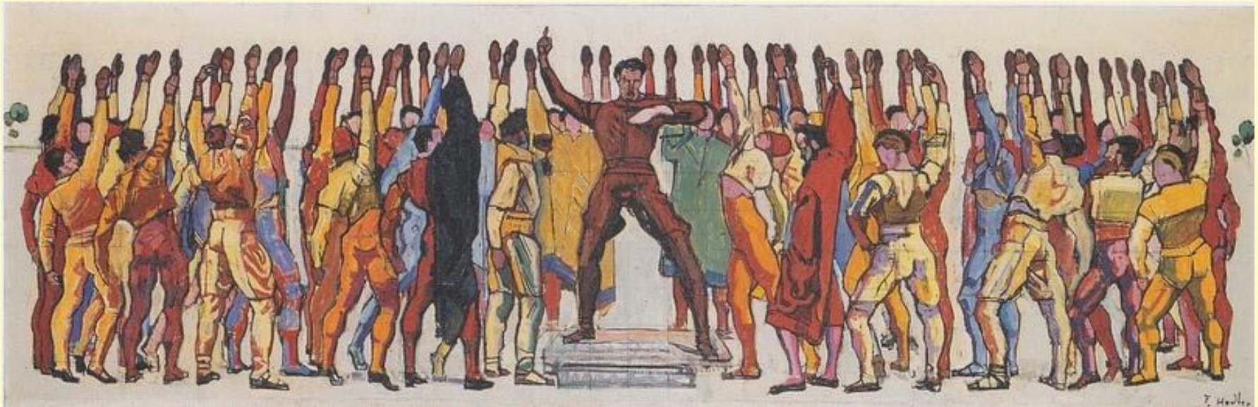
«Единодушие» («Клятва жителей Ганновера на верность Реформации», 1913 г.).