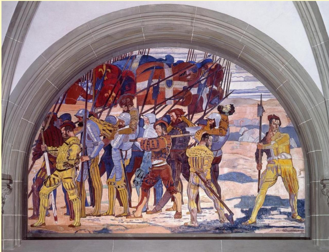
«Отступление при Мариньяно» (1896—1900 гг.)