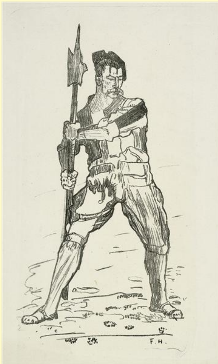
Эскиз к «Отступление при Мариньяно» (1896—1900 гг.)