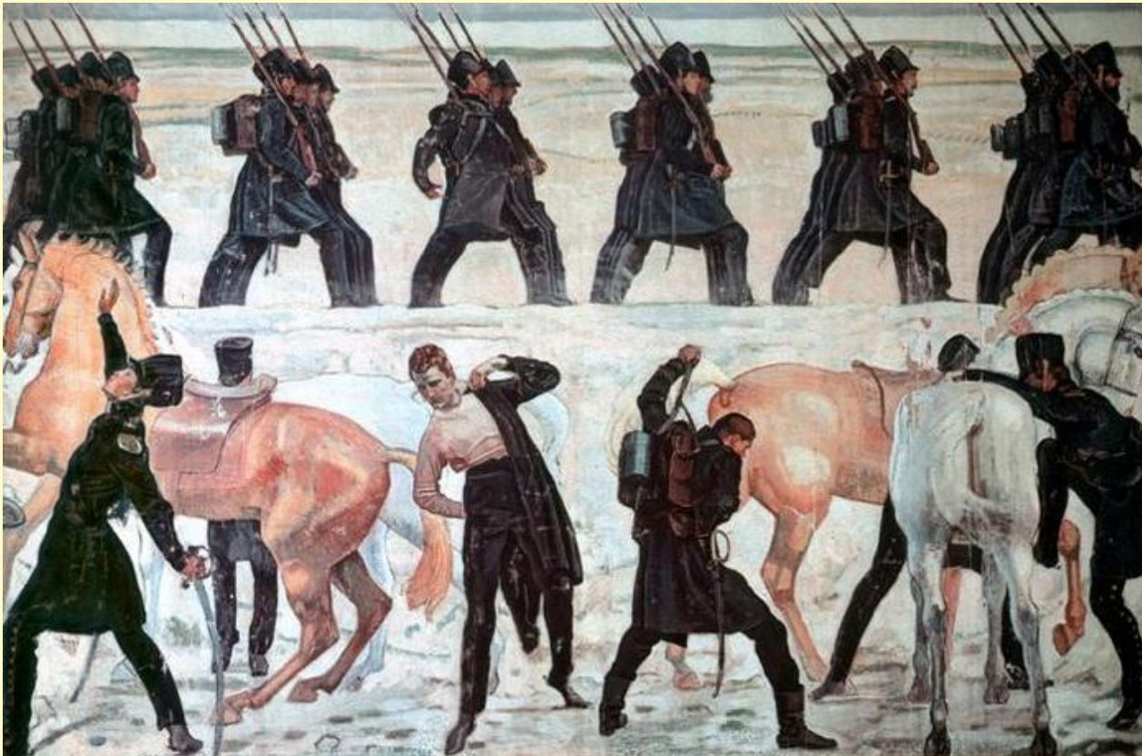
«Выступление йенских студентов в 1813 году» (1908 г.).