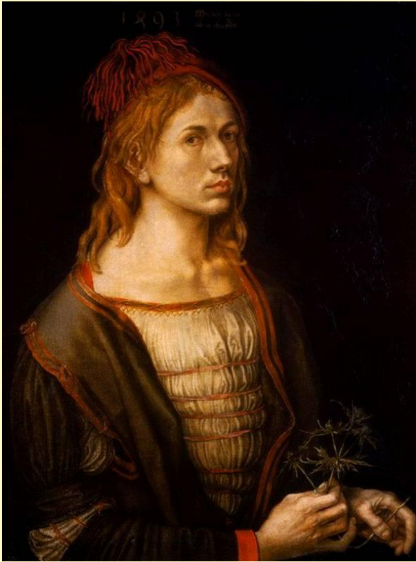
Портрет кисти Дюрера