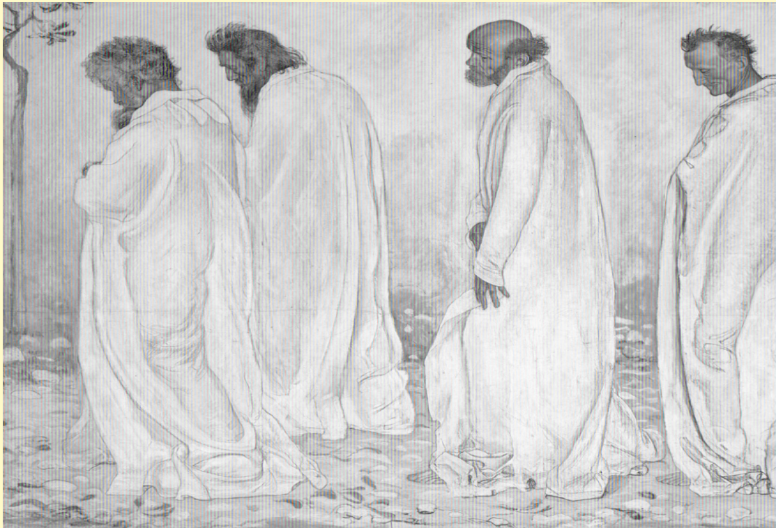
«Эвритмия» (1895 г.).