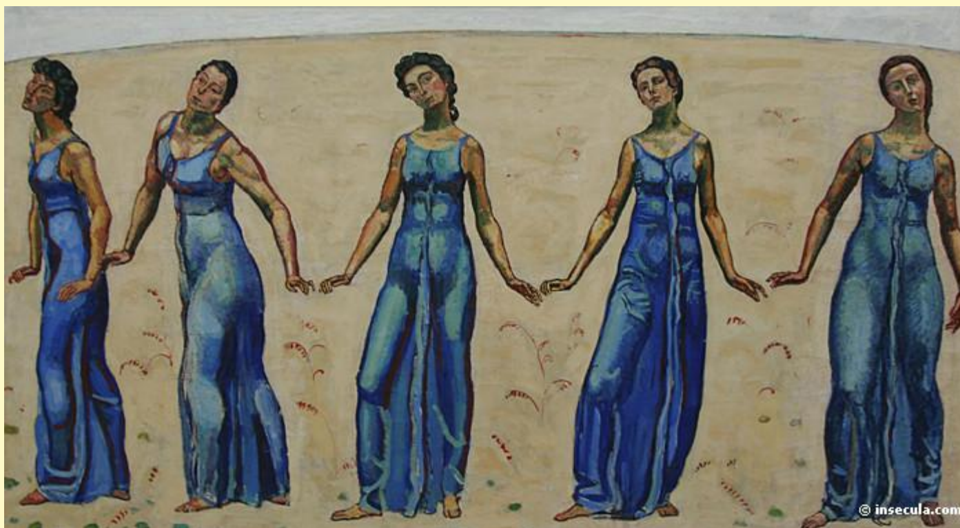
Взгляд в бесконечность 1916 г.