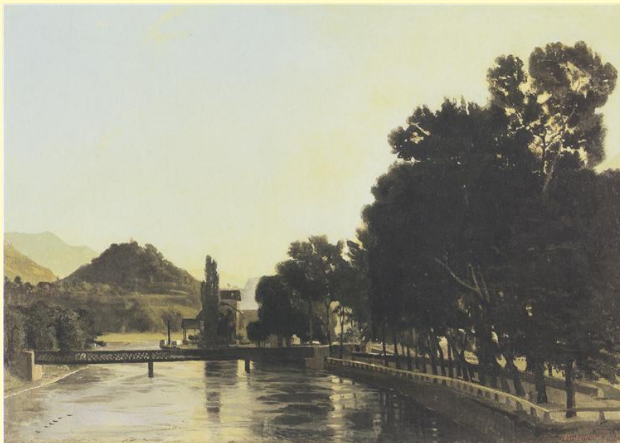
Утро. 1975 г.