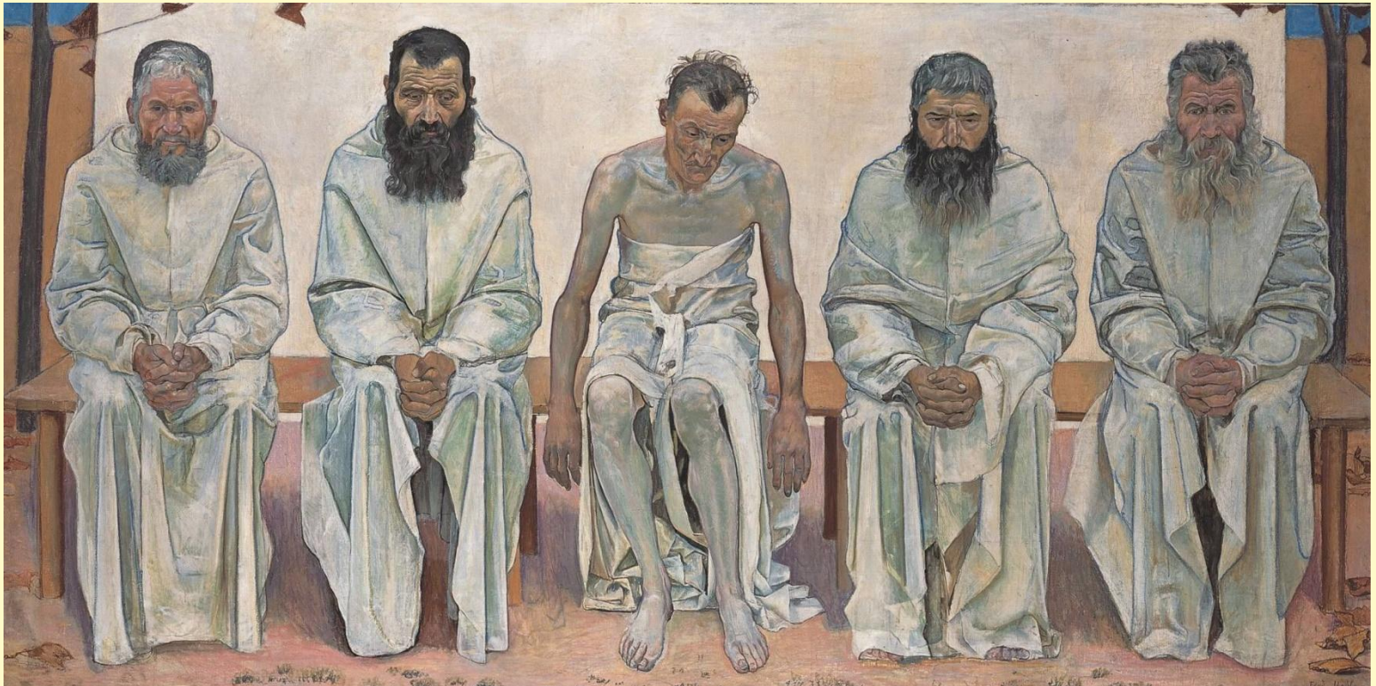
«Утомленные жизнью» 1892