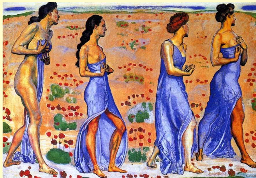
«Эмоции». 1912 г.