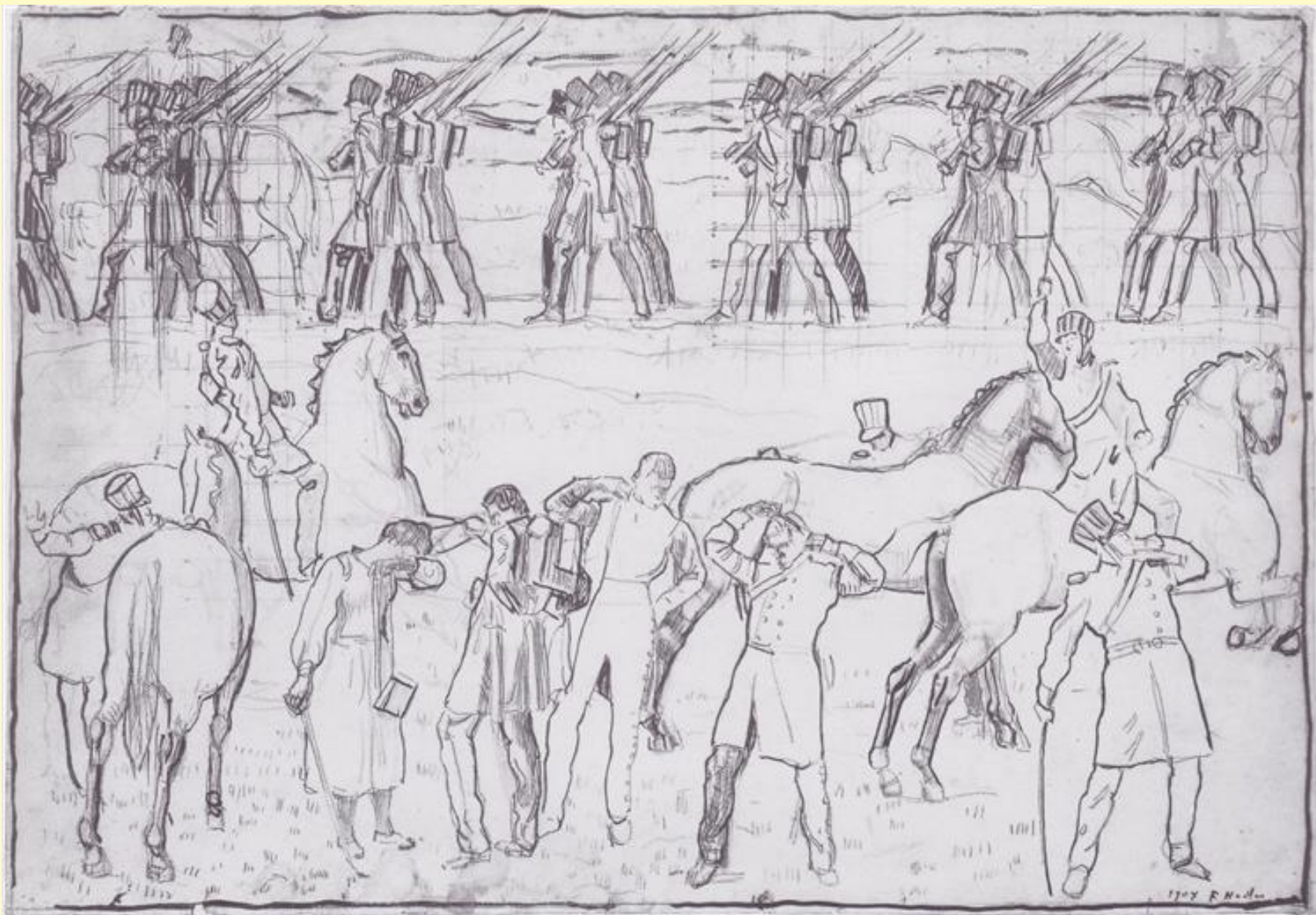
Эскиз к «Выступление йенских студентов в 1813 году» (1908 г.).