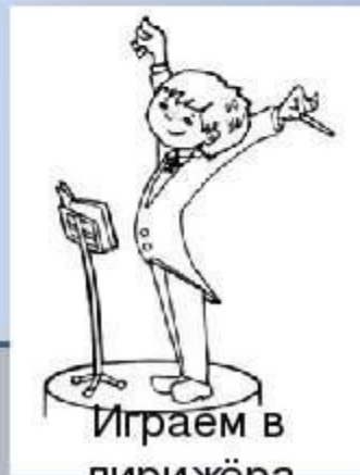
Играем в дирижёра