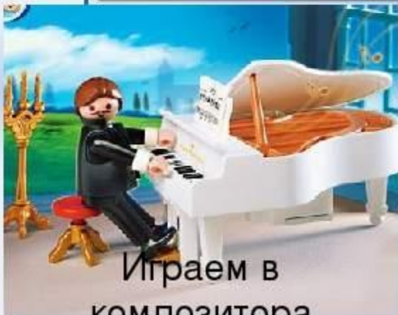
Играем в композитора