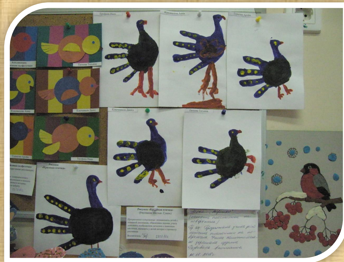
Работы, выполненные в рамках тематической недели «Птицы»