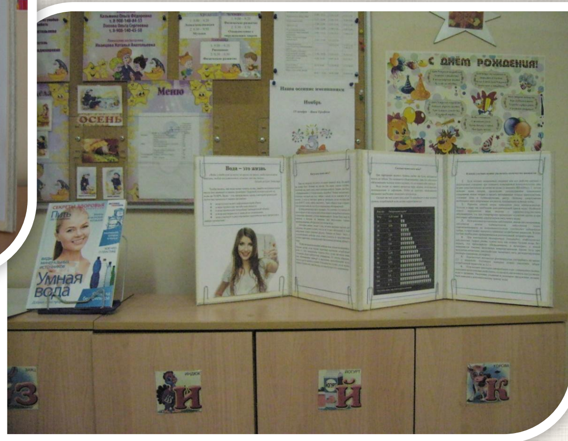
Информация (ширма): «Вода – это жизнь»