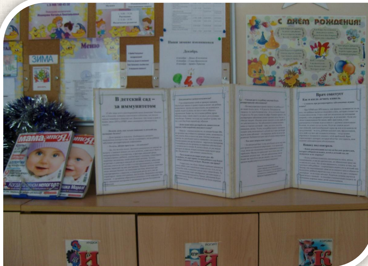
Информация (ширма): «В детский сад – за иммунитетом»