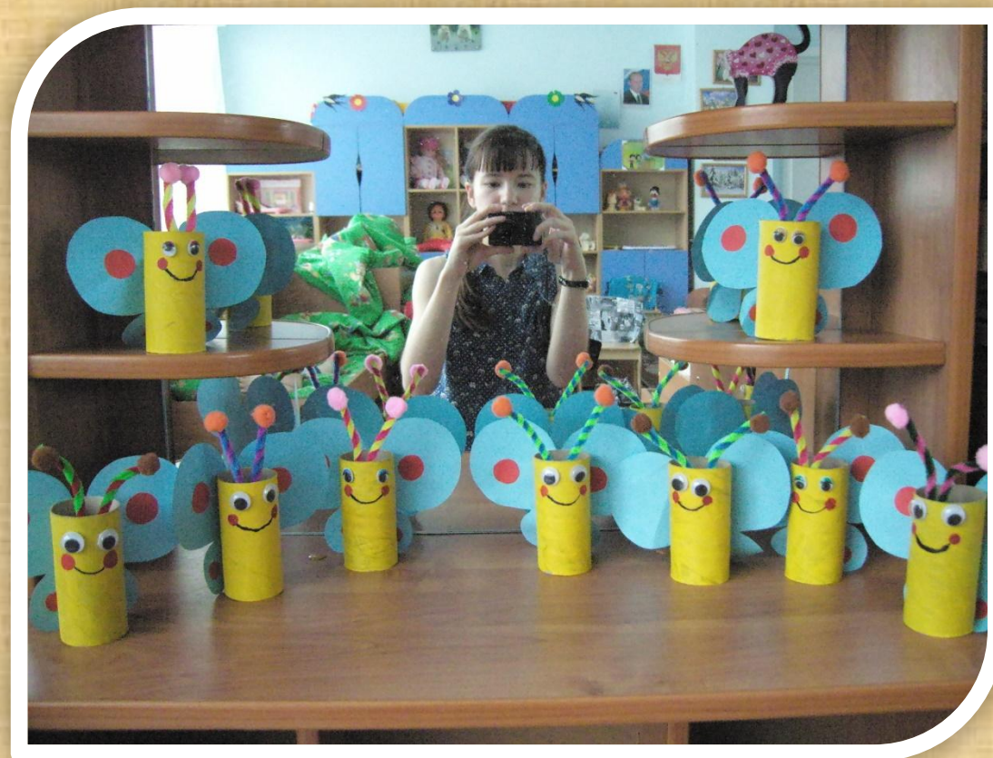
Кукла «Забавная бабочка»