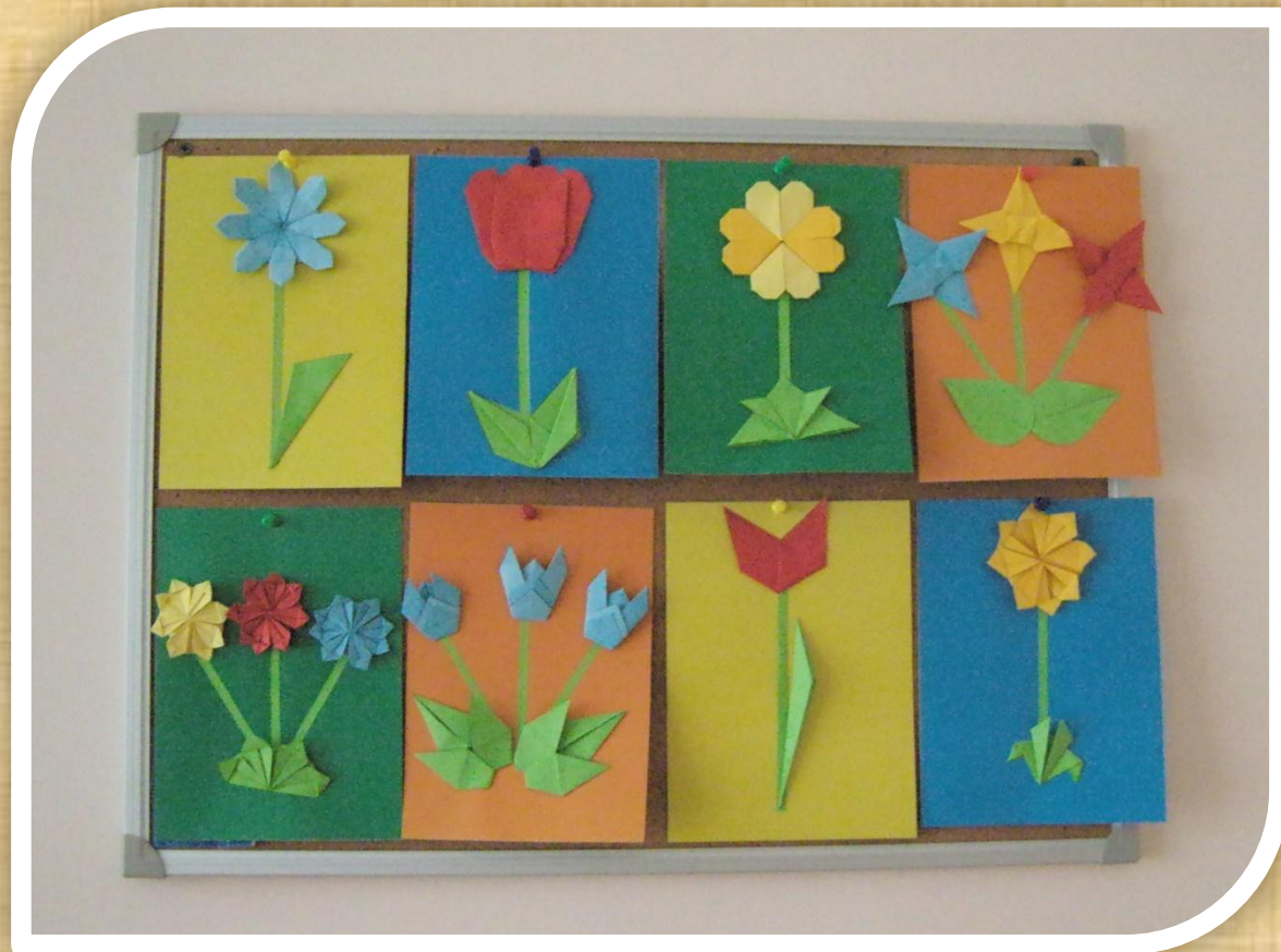
Аппликация «Весенние цветы»

Работы, выполненные в рамках тематической недели «Птицы»