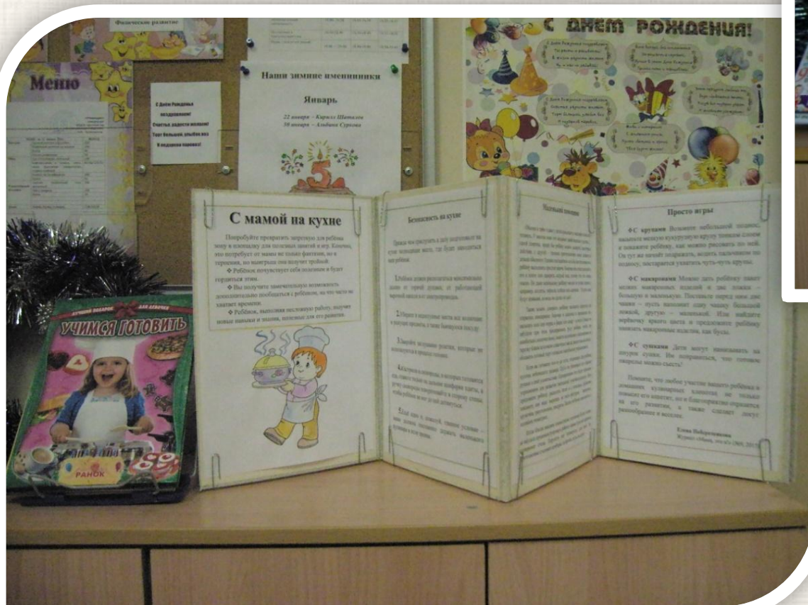
Информация (ширма): «С мамой на кухне»