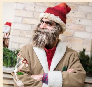
Дзмер Папи (ձմեր պապիկ), или Каханд Папи