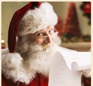
«Санта-Клаус» (Santa Claus)