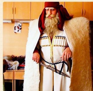
«Товлис Бабуа» (სანტა კლაუსი)