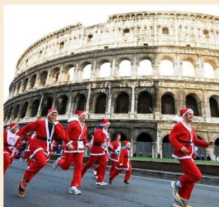
«Баббо-Натале» (Babbo Natale)