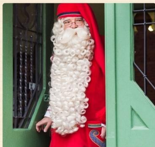
«Святой Николай» (Święty Mikołaj)