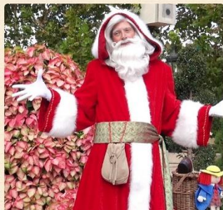
«Пер-Ноэль» (Père Noël)