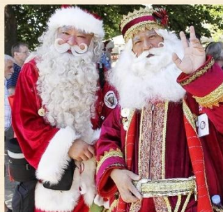
«Шань Дань Лаожен» (圣诞老人)