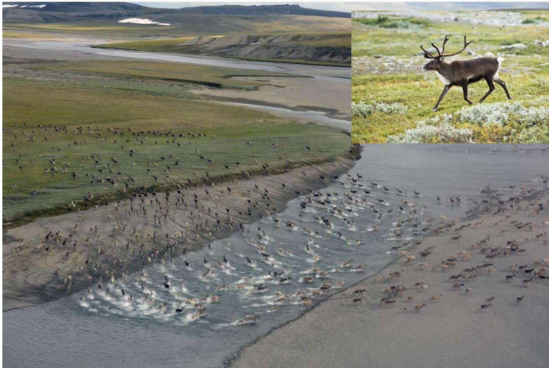
Миграция северных оленей