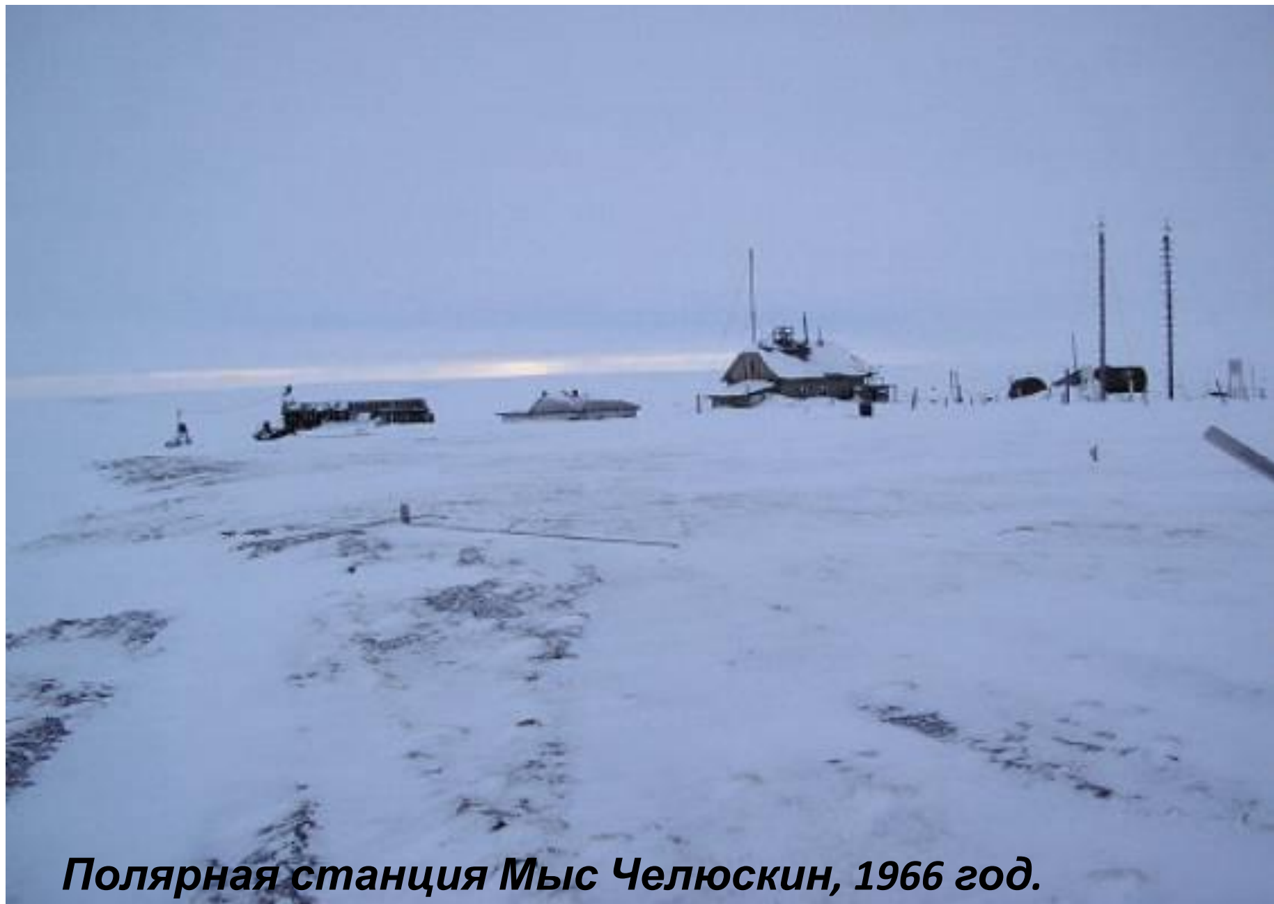
Полярная станция Мыс Челюскин, 1966 год.