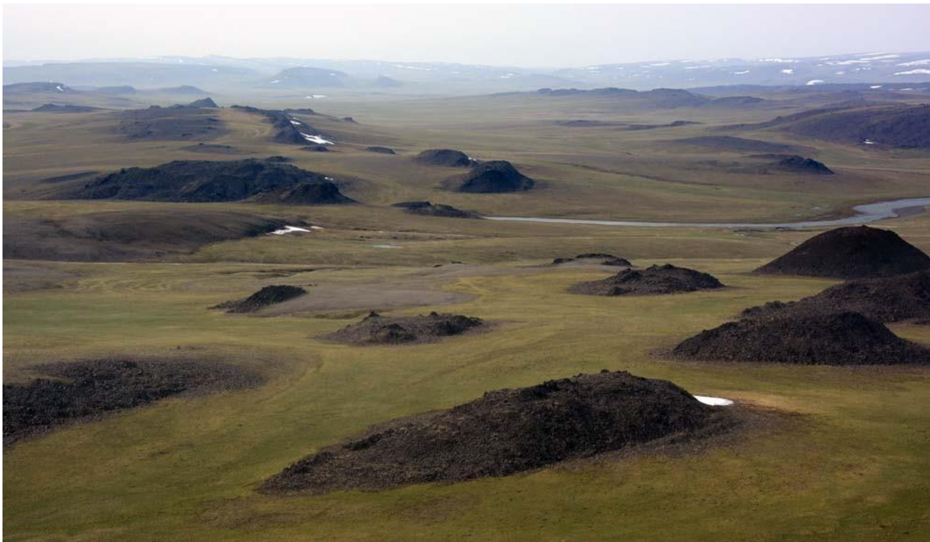
Следы ледниковых отложений