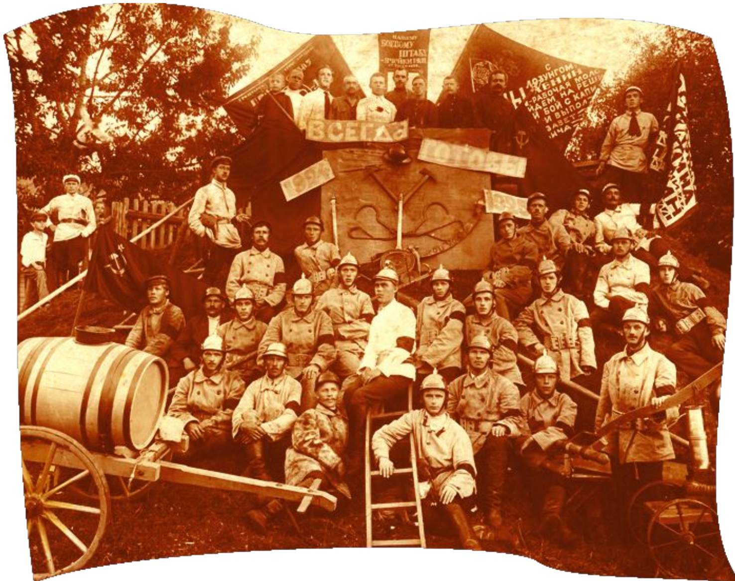
Добровольная пожарная дружина депо станции «Тихвин». 1925 г.