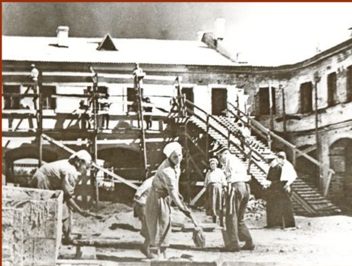
Восстановление Гостиного двора