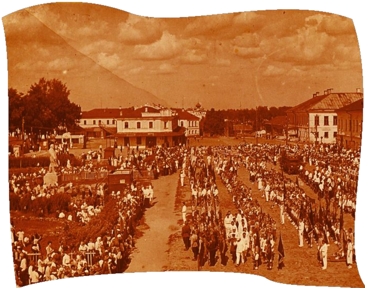
Парад 30 июня 1939 г.