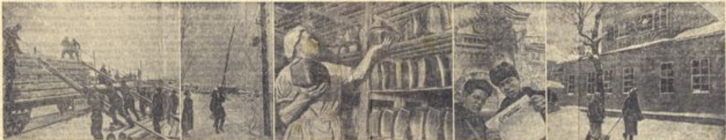
В ТИУВНЕ ПОСЛЕ ИЗГНАНИЯ ФАШИСТСКИХ ТАБОРНИКОВ НАЧИНАЕТ ВЕЛЖИВАТЬСЯ НОРМАЛЬНАЯ ЖИЗНЬ. 1. На железнодорожной станции работают системы со строительными материалами. 2. Советцы восстанавливают телефонную и телеграфную сети. 3. Старый оккер. 4. Девочка смотрит картину в музее, организованном в доме. 5. Начал выходить газета «Социалистическая служба». Железнодорожники Троицк и Сергь читают газетный номер газеты. 6. Рабочие приступили к ремонту поврежденного фашистами здания электростанции Ресколы-Керского.