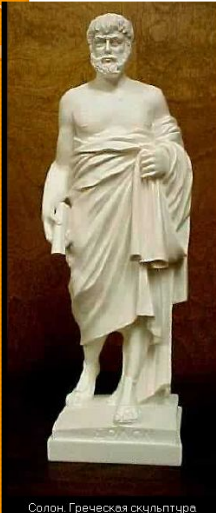
Солон. Греческая скульптура