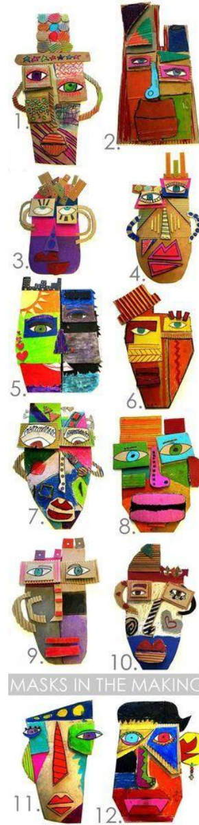
MASKS IN THE MAKING