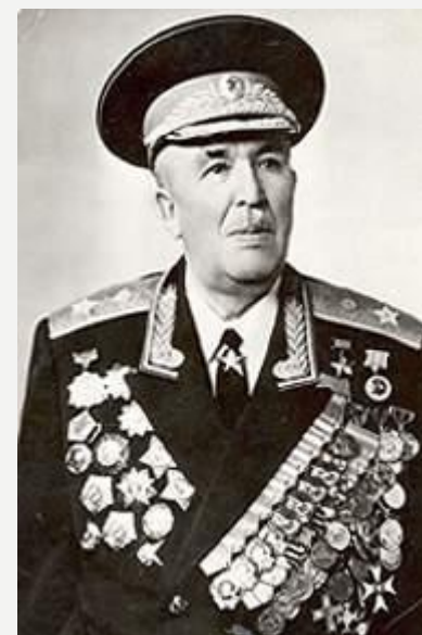
И. И. Федюнинский Герой Советского Союза