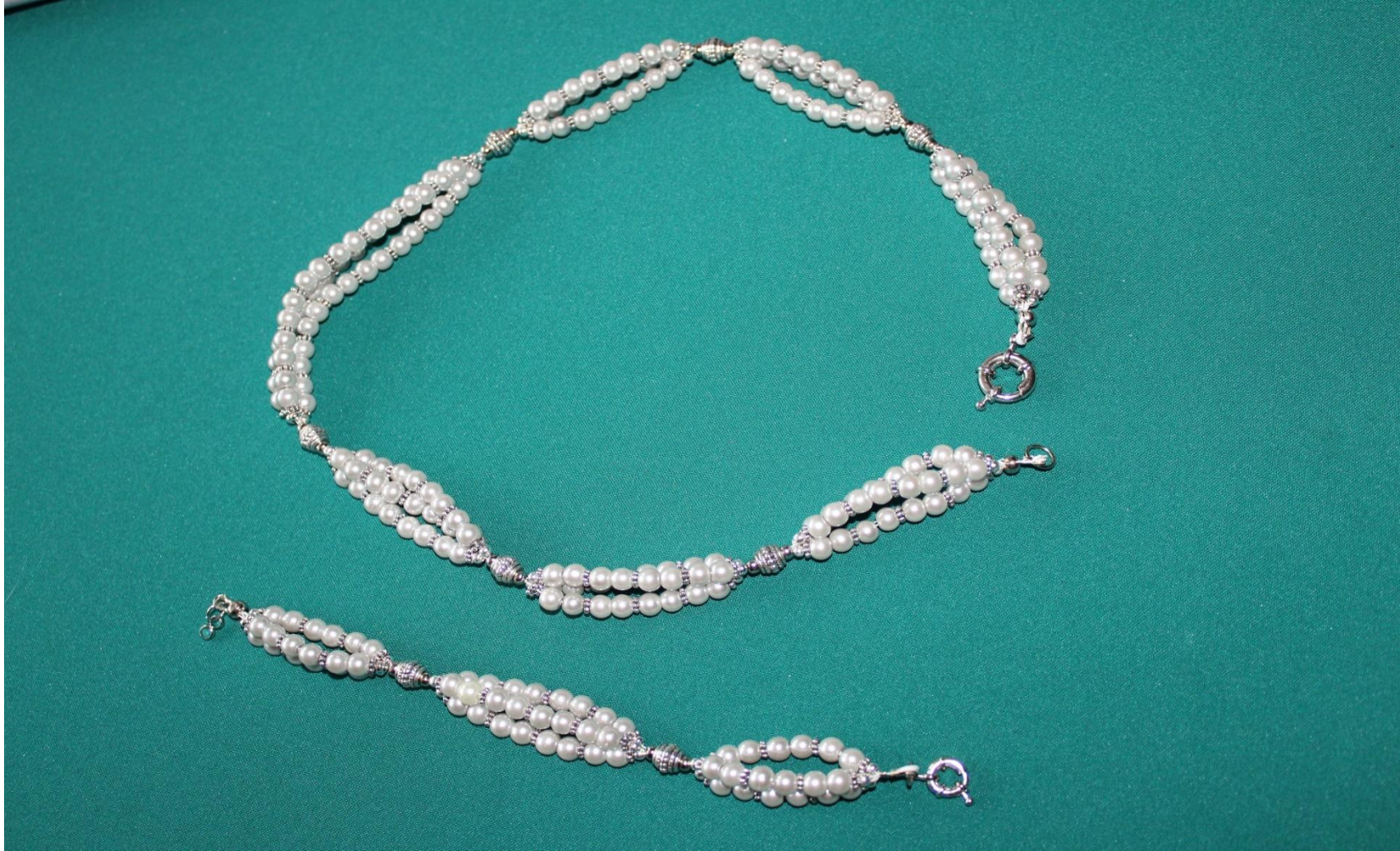
23. Бусы трехрядные с браслетом