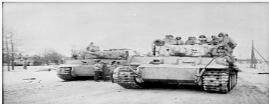
Німецький танк Tiger I

Дата: 24 січня 1944 — 17 лютого 1944 Місце: Корсунь, УРСР, СРСР Результат: Перемога Червоної Армії, оточення німецьких військ