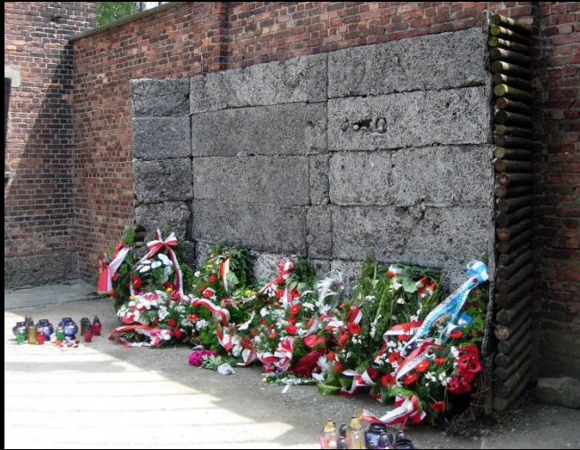
Стена казни. Аушвиц 1

Комплекс состоял из трёх основных лагерей: Аушвиц-1, Аушвиц-2 и Аушвиц-3. Общая площадь лагеря составляла примерно 500 га.