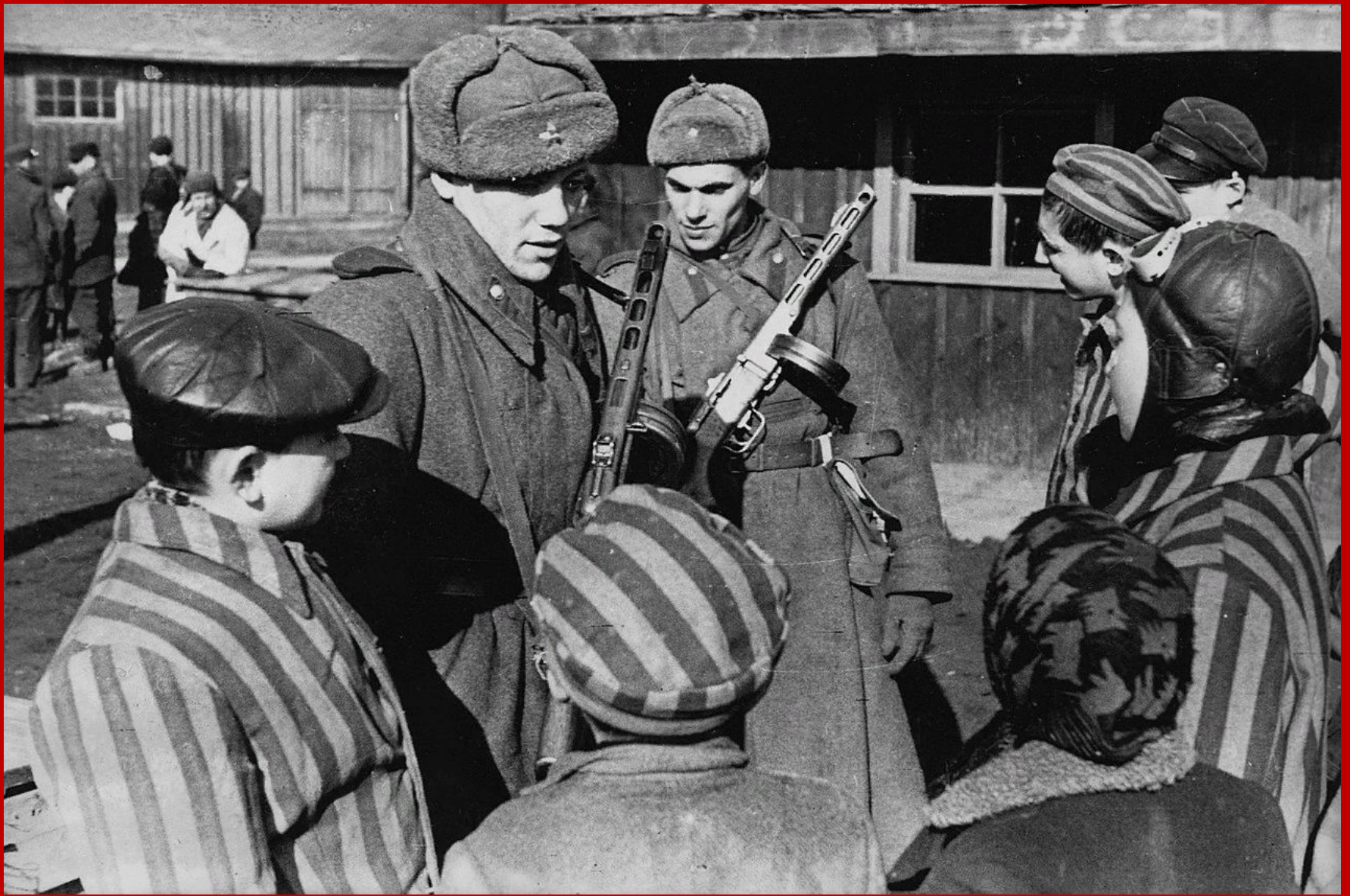
Советские солдаты общаются с детьми, освобождёнными из концлагеря