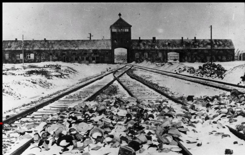
Аушвиц после освобождения