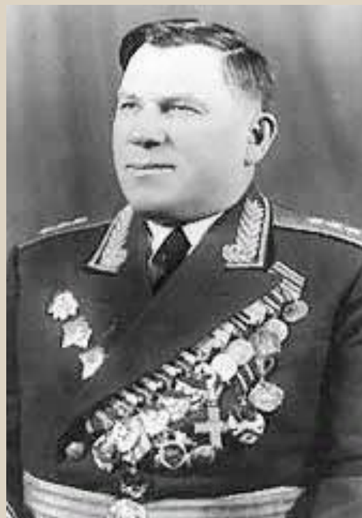
Иван Терентьевич Коровников (1902—1976) — советский военачальник, генерал-полковник (8 августа 1955 года).