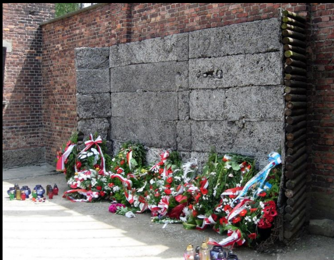
Стена казни. Аушвиц 1

Комплекс состоял из трёх основных лагерей: Аушвиц-1, Аушвиц-2 и Аушвиц-3. Общая площадь лагеря составляла примерно 500 га.