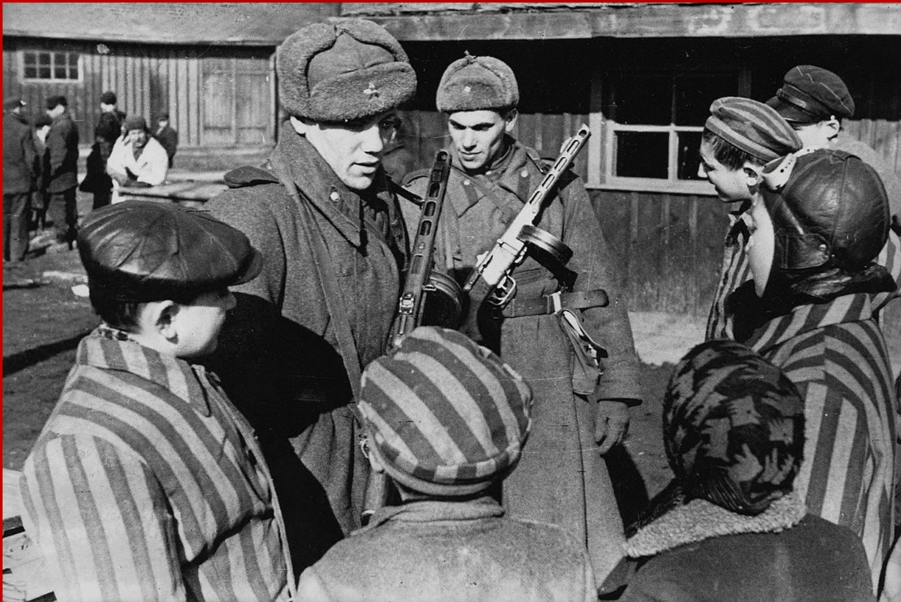
Советские солдаты общаются с детьми, освобождёнными из концлагеря