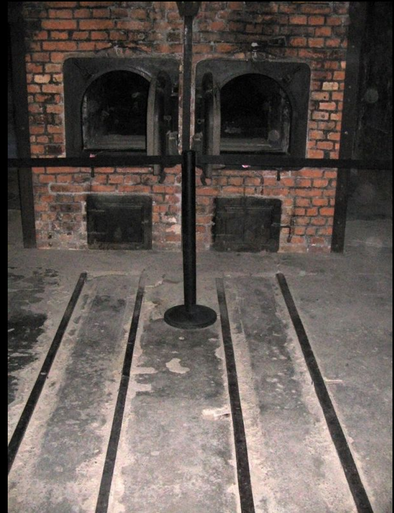
Сохранившиеся печи крематория. Аушвиц 1