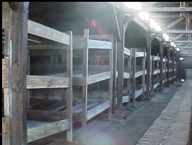
Внутри жилого барака. Аушвиц II (Биркенау)