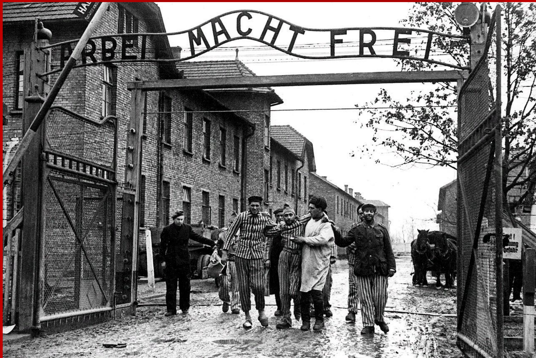
Советские солдаты выводят освобождённых узников концлагеря