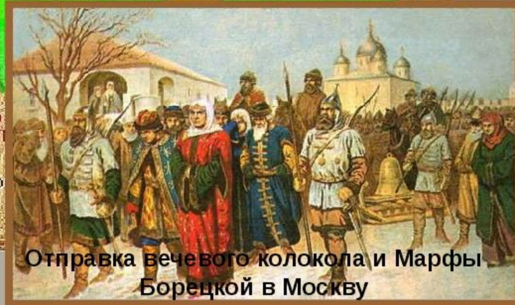
Отправка вечевого колокола и Марфы Борецкой в Москву

1478 год – ликвидация новгородского вече, присоединение к Москве