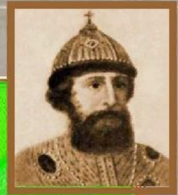
ИВАН III (1462-1505)

1471 год – московское войско разбило новгородцев на р.Шелони