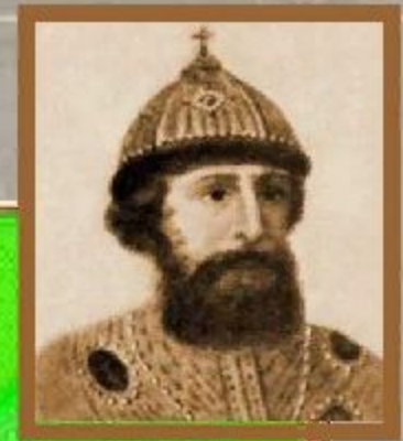
ИВАН III (1462-1505)