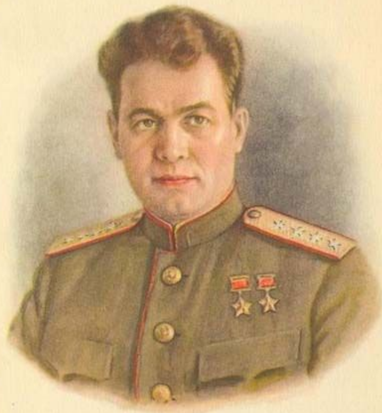
Дважды Герой Советского Союза генерал армии Иван Данилович ЧЕРНЯХОВСКИЙ (1906 – 1945)

25 января 1943 года советскими войсками 60-й армии под командованием генерала И.Д. Черняховского был освобожден Воронеж.