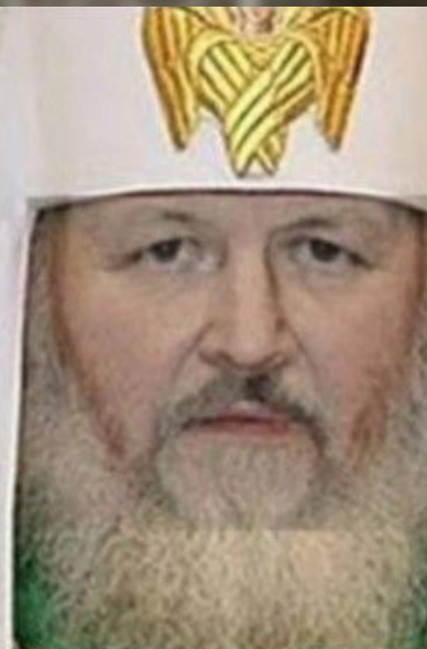
Патриарх Кирилл Гундяев