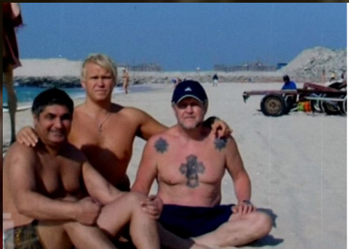
№2. Иваньков Вячеслав Кириллович («Япончик»)