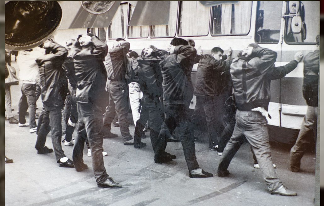
Облава мусорами Солнцевского ОПГ