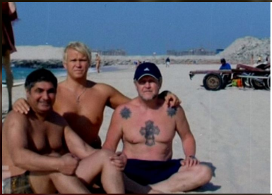
№2. Иваньков Вячеслав Кириллович («Япончик»)