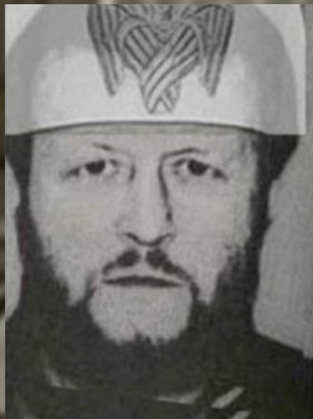
Вячеслав Иваньков Япончик